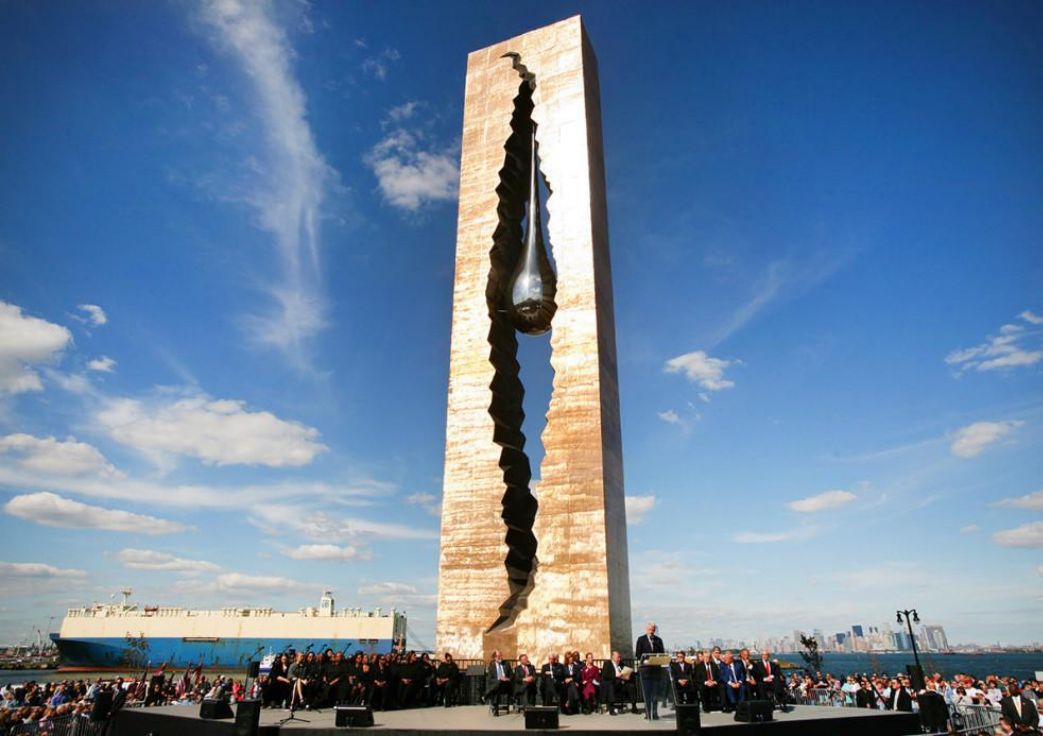
Монумент «Слеза скорби» Зураба Церетели, Нью-Джерси.