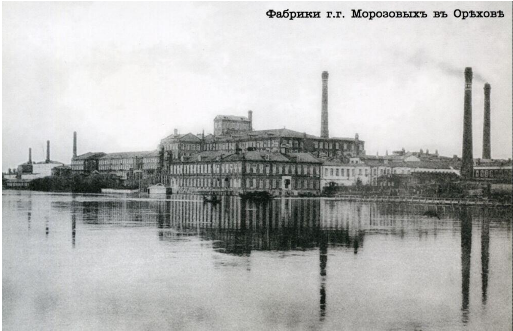
Фабрики г.г. Морозовыхъ въ Орѣховѣ

В 1820 году Савва Морозов вместе с сыновьями выкупается на волю за 17 тысяч руб. В 1820 -1840-е годы Морозовы создали четыре хлопчатобумажных фабрики, которые во второй половине XIX века вырастают в четыре огромных фирмы. Перед революцией собственные капиталы семьи составляли более 110 млн. руб.