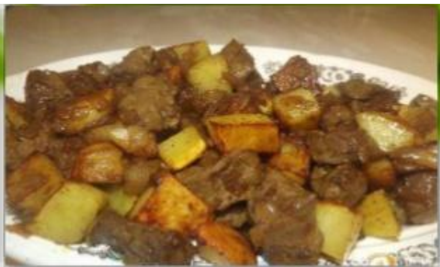
говурма из печен