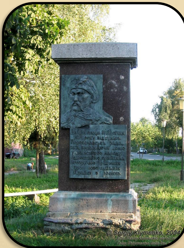
Переяслав-Хмельницький. Площа, на якій 1654 відбулася Переяславська рада.