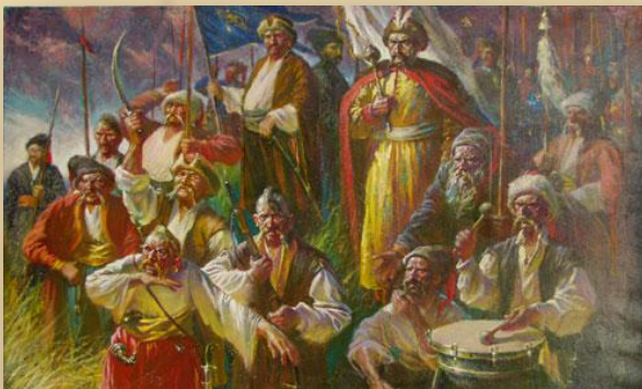
Битва під Жовтими водами