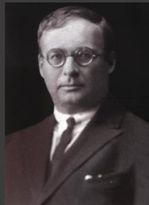
Б. Я. Владимирцов