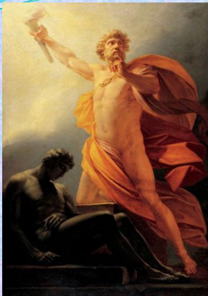
Прометей приносить людству вогонь. Генріх Фюгер, Париж, 1817 р.

У світову літературу у зв'язку з образом Прометея до вжитку увійшов термін "прометеїзм", тобто неугасиме прагнення до свободи, до нових звершень у науці, поезії, мистецтві, невмируща потреба в героїчних діяннях на благо народу, інакше — "Прометеїв вогонь", "дух, що тіло рве до бою", за висловом Івана Франка.