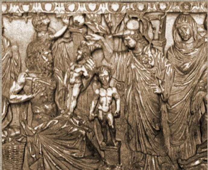
Історія Прометея. Антична скульптура

Створений Шевченком образ Прометея, попри всю його епізодичність, має символічний характер. Дослідники не раз вказували на те, що він символ народу, який бореться, і з цим важко не погодитися. Про це свідчать і рядки поеми, звернені до борців проти поневолення і тиранії: „Борітеся – поборете...”