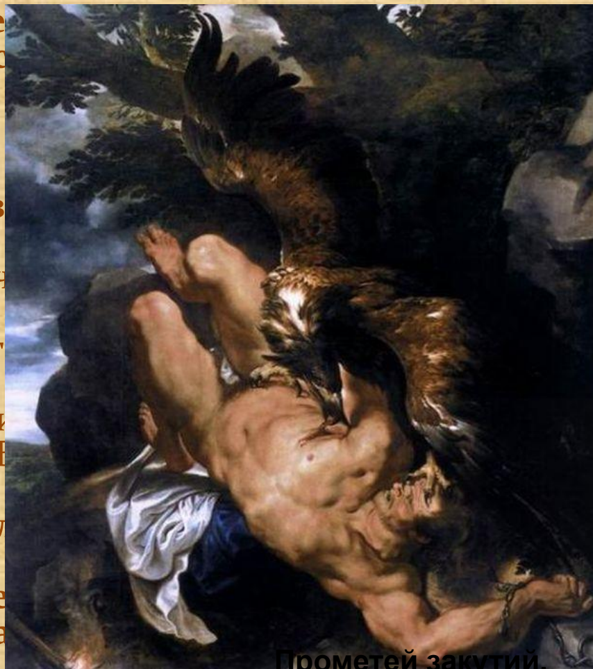
Прометей закутий. Якоб Йорданс, бл. 1640 р.

Особливої популярності образ Прометея набуває за доби романтизму. Він стає романтичним символом непокори, тираноборства і людинолюбства. Яскравим свідченням цього є спадщина видатних англійських романтиків - Дж. Байрона і П.Б. Шеллі, у творчості яких образ Прометея відіграє важливу роль. Недарма ж Байрона називали „Прометеем XIX століття”, а Меґ Шеллі, дружина поета, зазначала, що „Прометей — душа поезії „Шеллі”.