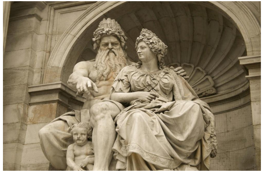
Зевс и Гера