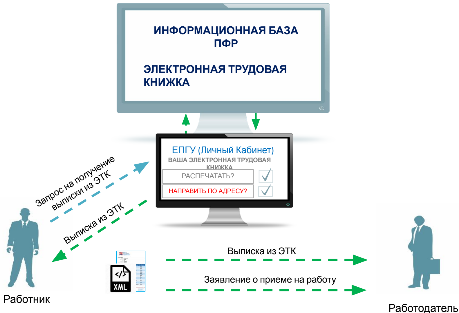
Схема направления работником через ЕПГУ работодателю на электронный адрес выписки из Электронной трудовой книжки