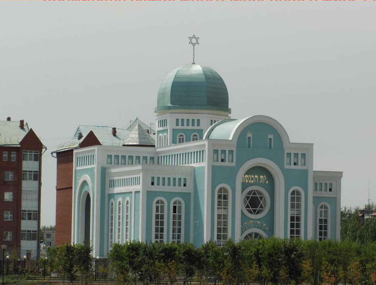
Москва, главная синагога

Иудейские общины появились во многих городах Польши, Литвы, и их численность все время росла. Шло время, и в 18 веке к России отошли земли Польши и Литвы, которыми некогда владели русские князья. Так среди народов Русского государства оказалось большое число евреев – последователей иудаизма. Россия стала государством, где проживала самая многочисленная в мире еврейская община.