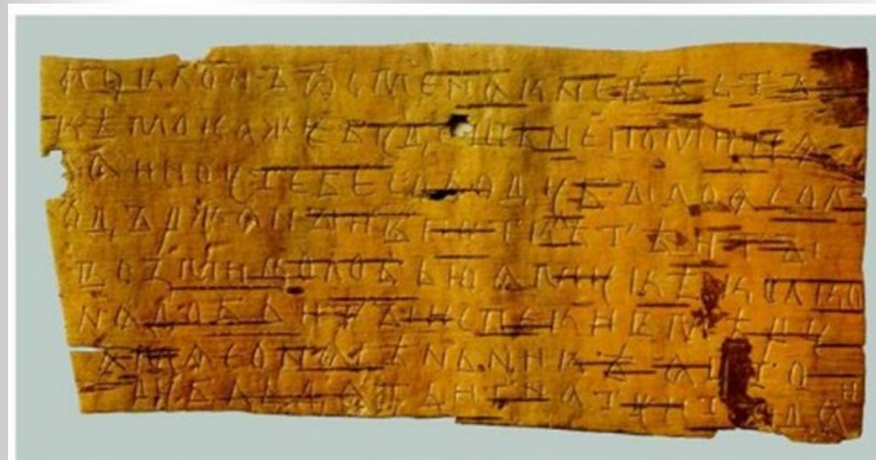
Гривота № 363. Конец XIV в. Письмо Семёна писаное с хлѣбѣстѣннымъ распорѣзѣнкомъ. Размер 16,4 × 8 см.