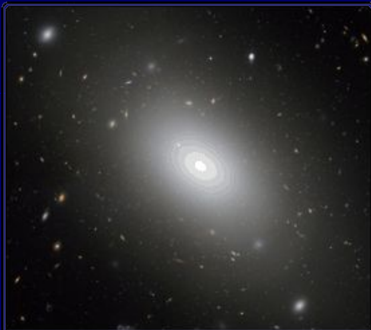
Галактика NGC 1132