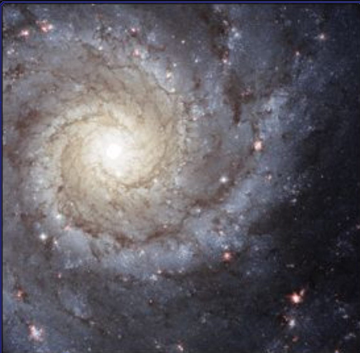
Спиральная галактика M74