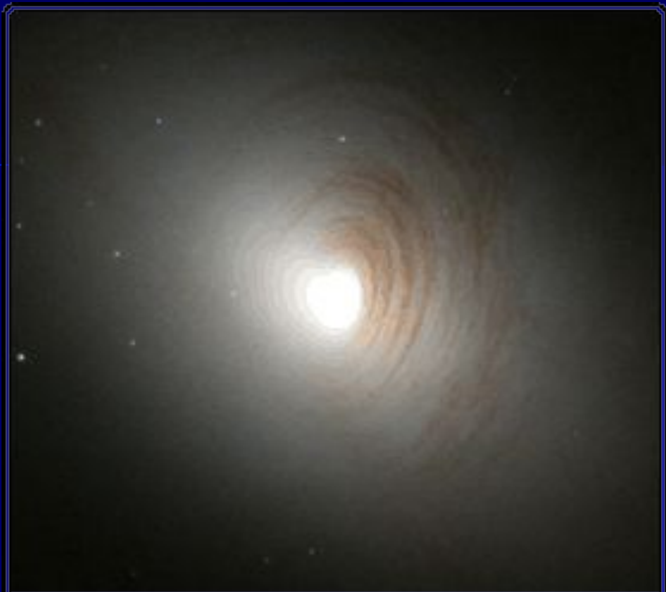
Линзовидная галактика NGC 2787