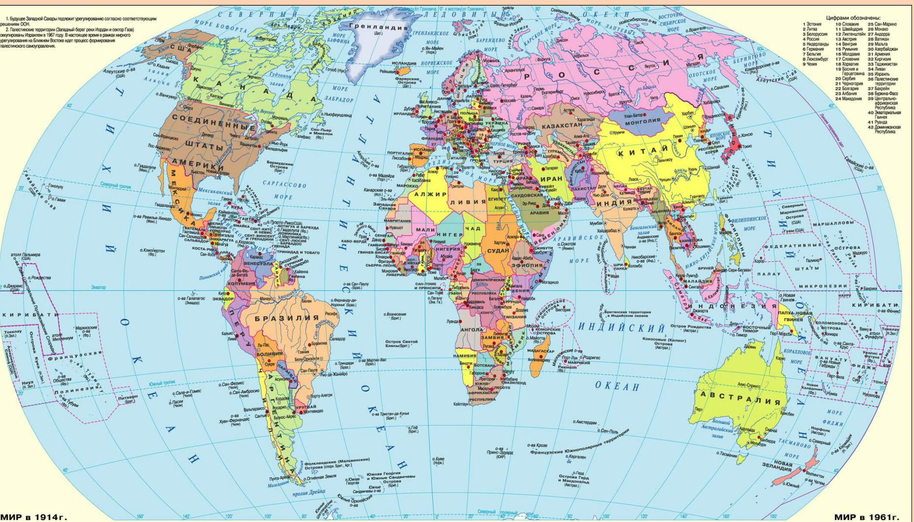
МИР в 1914 г.

1. Будущие Западной Сахары подлежит урегулированию согласно соответствующим решениям ООН. 2. Палестинские территории (Западный берег реки Иордан и сектор Газа) урегулированы Израилем в 1967 году. В настоящее время в рамках широкого урегулирования на Ближнем Востоке идет процесс формирования палестинского самоуправления.