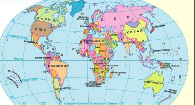
МИР в 1961 г.

Цифрами обозначены: 1 ФГГ - Федеративная Республика Германия 15 Западный Иран (Италия) 33 Гвинея-Бисау (Португ.) 2 ГДР - Германская Демократическая Республика 16 Марокко о-ва (США) 34 Гамбия (Брит.) 3 Чехословакия 17 Каролинские о-ва (США) 35 о-в Зеленого Мыса (Португ.) 4 Югославия 18 Каролинские о-ва (США) 36 о-в Марионий (Брит.) 5 Демократическая Республика Конго 19 о-в Гилберта (Брит.) 37 Коморские о-ва (Фран.) 6 Оман и Маскат (Брит.) 20 о-в Фиджи (Брит.) 38 Мозамбик (Португ.) 7 Араб. Эмир. Оман 21 о-ва Новая Гвинея (Брит. и Фран.) 39 Федеративная Республика Южная Африка 8 Пакистан 22 Индийские Саванна (Брит.) 40 Свазиленд (Брит.) 9 Восточный Пакистан (в Пакистане) 23 Арабская Республика Египет 41 Свазиленд (Брит.) 10 Швейцария 24 Французские Сомали (Фран.) 42 Свазиленд (Брит.) 11 Мальдивские о-ва (Брит.) 25 Кения (Брит.) 43 Батумские о-ва (Брит.) 12 Шри-Ланка (Брит.) 26 Кения (Брит.) 44 Батумские о-ва (Брит.) 13 Южная Вьетнам (Франция) 27 Франция (Брит.) 45 о-в Ямайка (Брит.) 14 Северный Вьетнам (Франция) 28 Бруней (Бельгия) 46 Вост.-Индийская Федерация (Брит.) 15 Северное Борнео (Брит.) 29 Дания 47 Бруней-Даруссалам (Брит.) 16 Южная Вьетнам (Франция) 30 Дания 48 Нидерландская Гвинея 17 Марокко о-ва (США) 31 Северное Борнео (Брит.) 49 Французская Гвинея 18 о-в Гум (США) 32 Берг Слоновой Кости (Брит.)