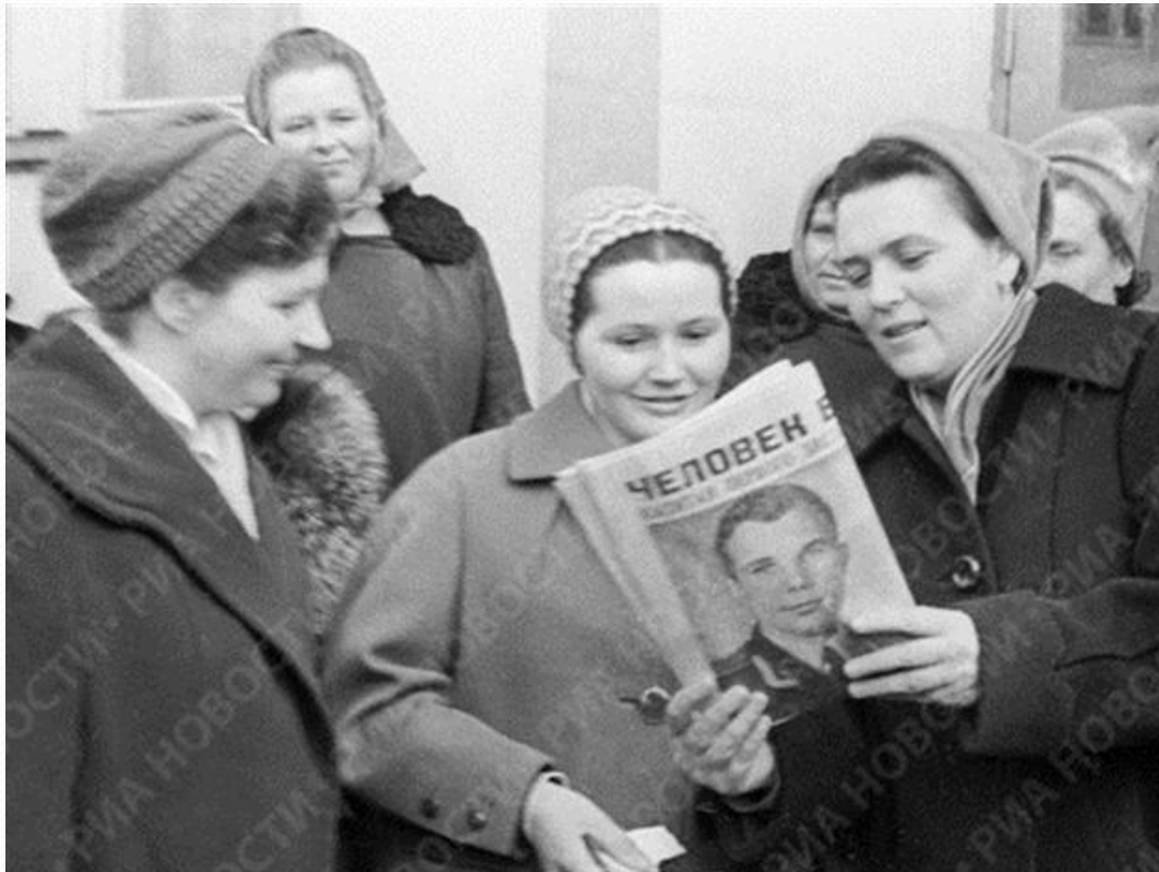
Мешканці Закарпаття готуються до візиту М.Хрущова. 1961 р.