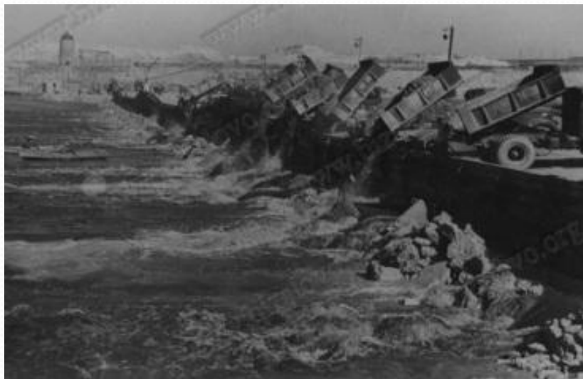
Будівництво Каховської ГЕС