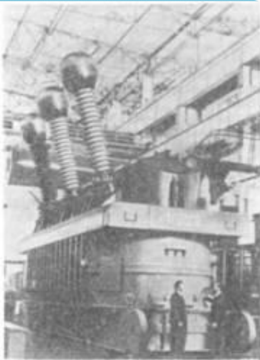
Трансформатор потужністю 1 000 000 кВа, виготовлений на Запорізькому трансформаторному заводі.

Кукурудзозбиральний комбайн. Технологічна схема «Херсонця-7В»: 1 — рама; 2 — різальний апарат; 3 — стеблоподавальний механізм; 4 — апарат з початковідривальними вальцями; 5 — пристрій, що подрібнює і подає листкостеблову масу; 6 — елеватори для неочищених початків; 7 — очищувальний апарат; 8 — транспортер для обгортки початків; 9 — елеватор для очищених початків; 10 — тракторний причіп.