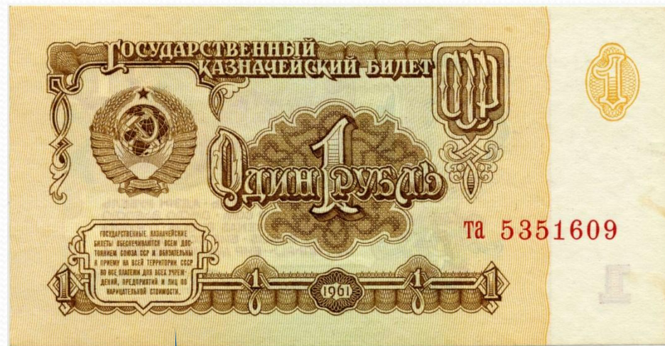
1 крб. 1961 року

Із доповіді М. Хрущова на сесії Верховної Ради СРСР 1960 р.