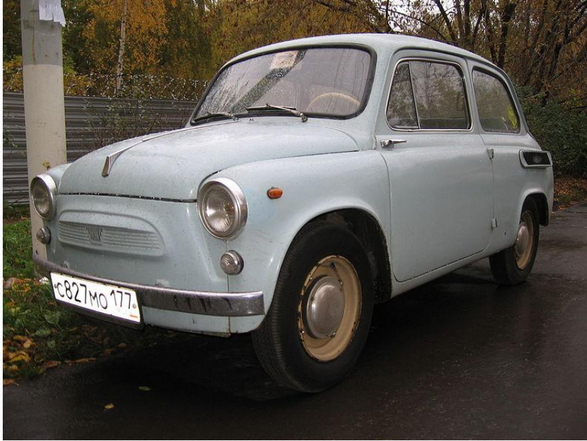
ЗАЗ 965 А, випущений в 1961 р. на Запорізькому автомобільному заводі