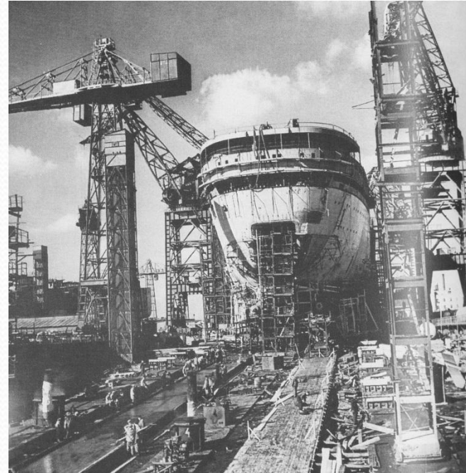
Миколаївський суднобудівний завод розпочав випуск суховантажних суден та риболовецьких траулерів