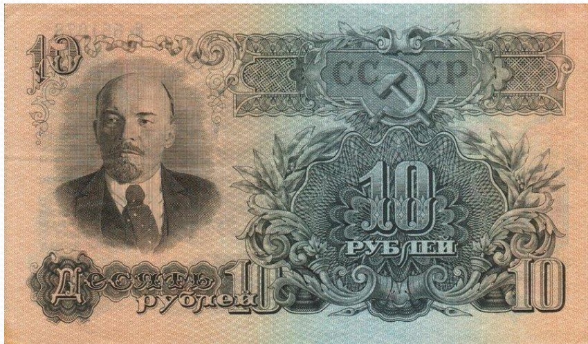
10 крб. 1947 року