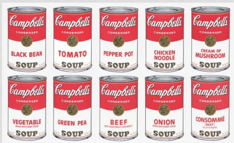
Энди Уорхолл. Суп. 1960е.