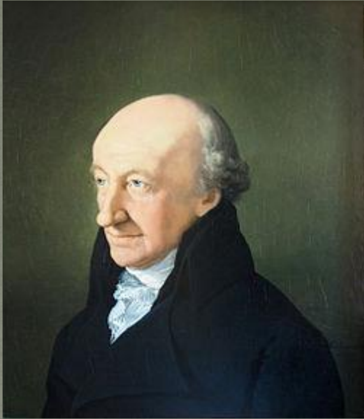
Виланд Кристоф Мартин

21 августа 1787 г. ознаменовало новую важнейшую веху в биографии Шиллера, связанную с его переездом в центр национальной литературы - Веймар. Туда он прибыл по приглашению К. М. Виланда для того, чтобы сотрудничать с литературным журналом «Немецкий Меркурий». Параллельно в 1787-1788 гг. Шиллер выступал издателем журнала «Талия».