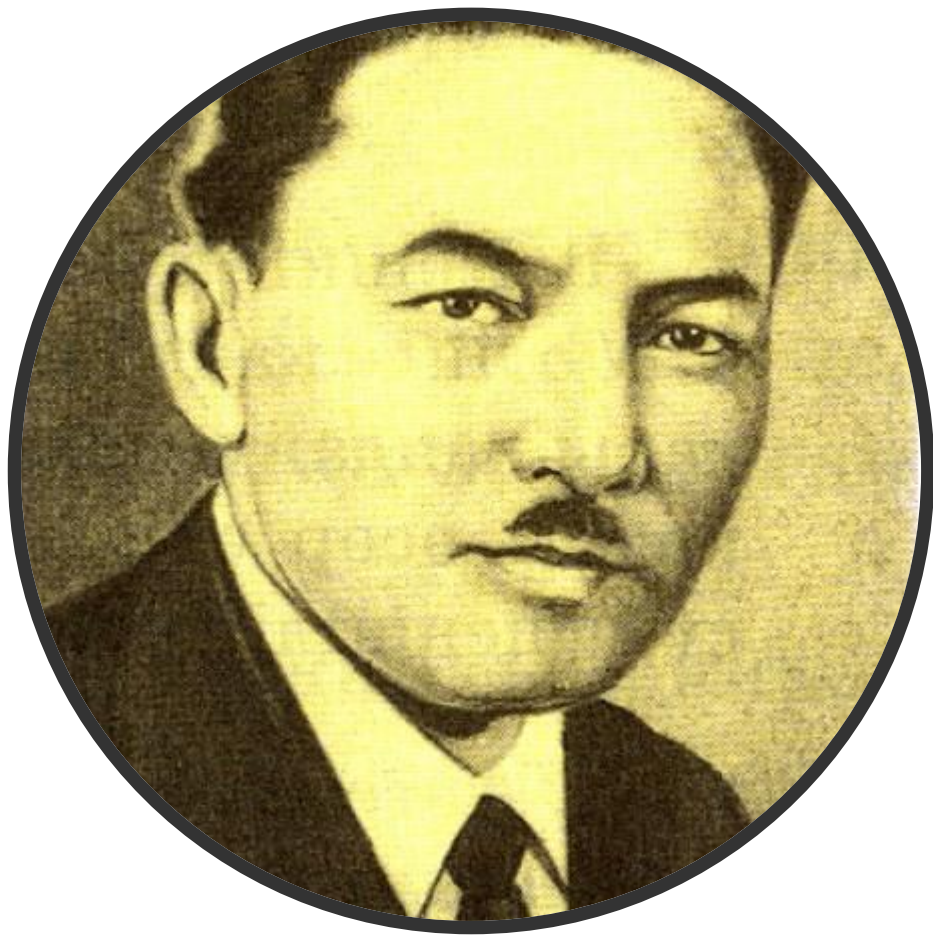
Жүсіпбек Аймауытов 1889-1931