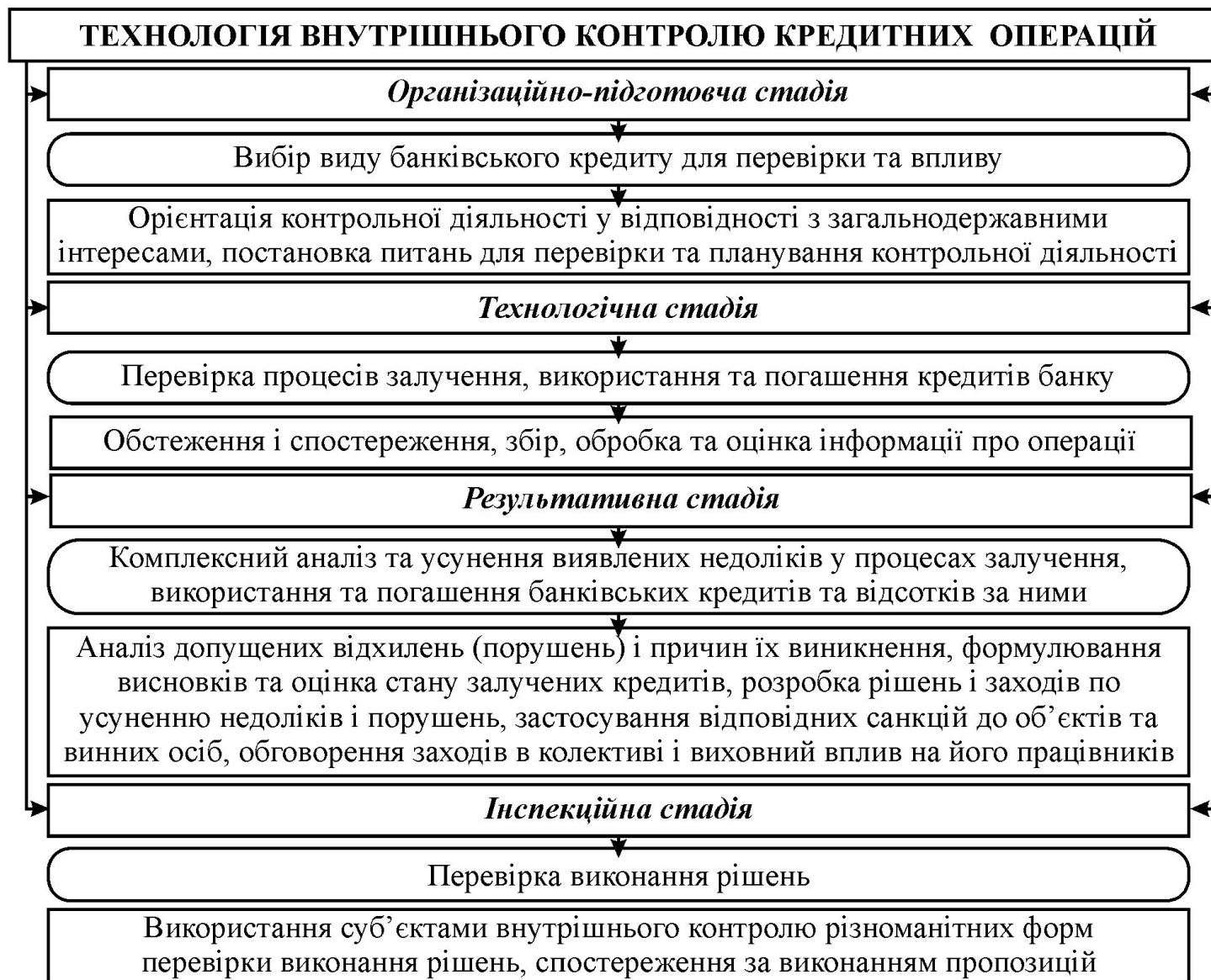
Рис. 5. Технологія внутрішнього контролю кредитних операцій в ТОВ НПК «ТЕХМЕТ»