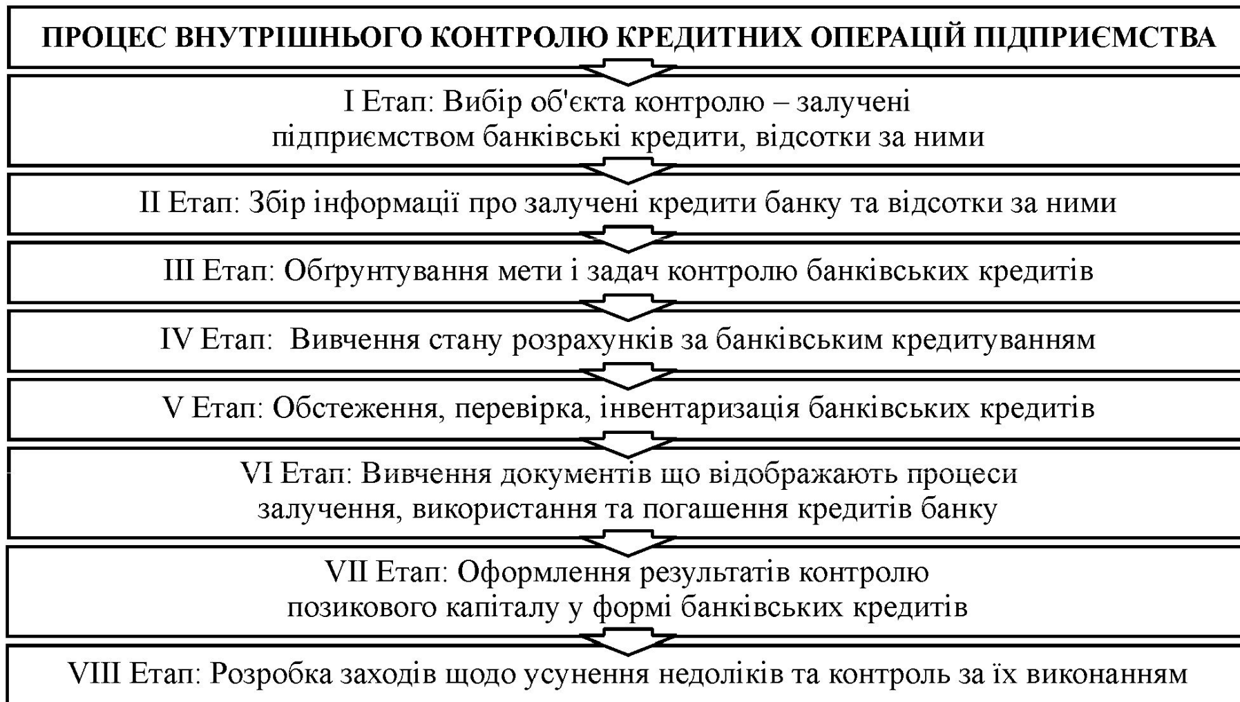
Рис. 4. Процес внутрішнього контролю позикового капіталу у формі банківських кредитів в ТОВ НПК «ТЕХМЕТ»