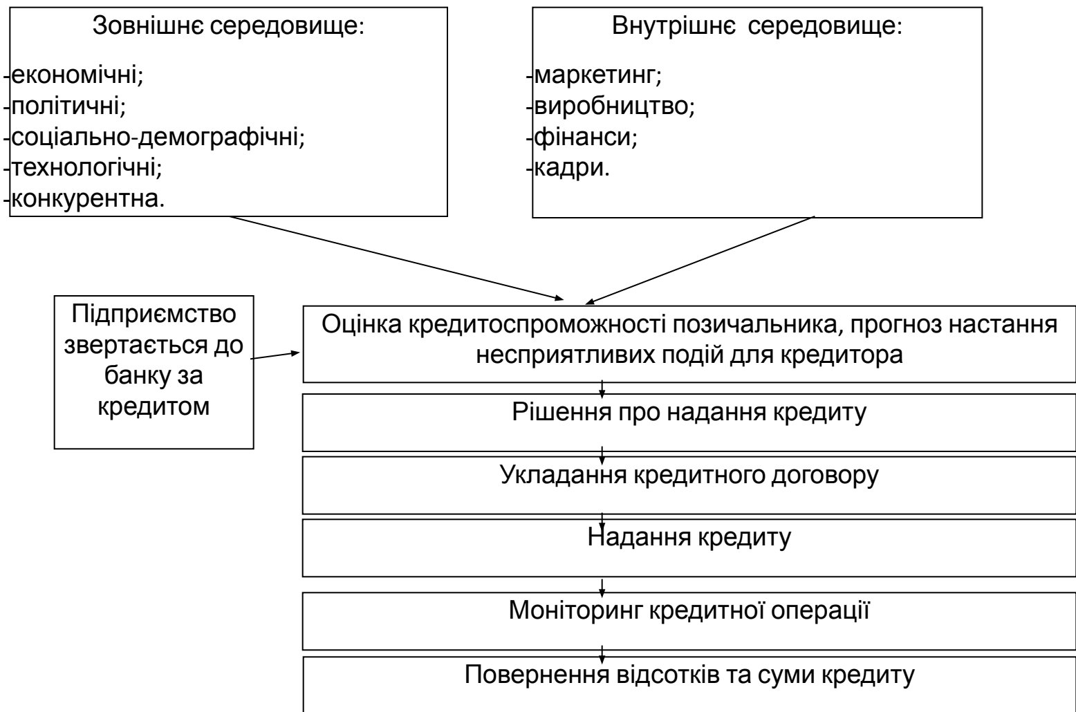
Рис. 1. Місце оцінки кредитоспроможності в механізмі кредитування підприємства