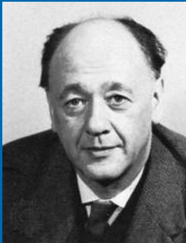
Ежен Йонеско (1912-1994)