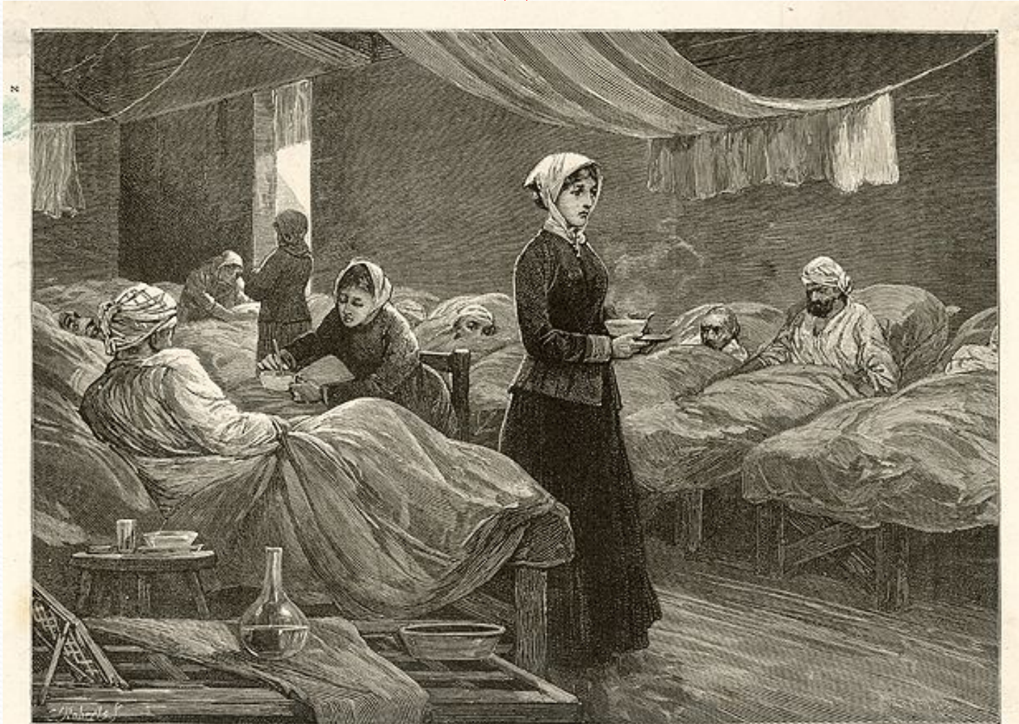
MISS NIGHTINGALE IN THE BARRACK HOSPITAL AT SCUTARI.

Выхаживая больных, она добилась снижения смертности с 42 до 2%