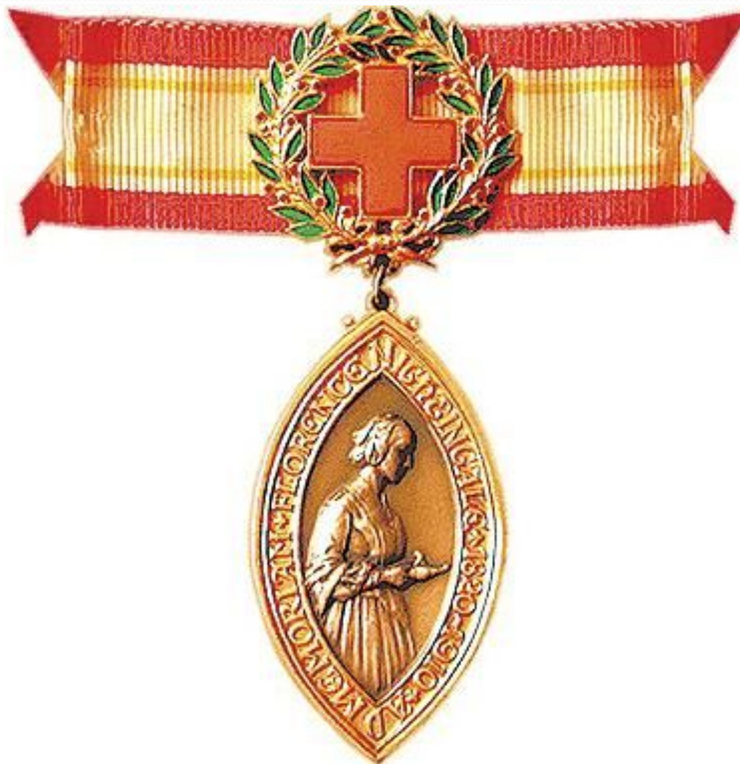
медаль имени Флоренс Найтингейл