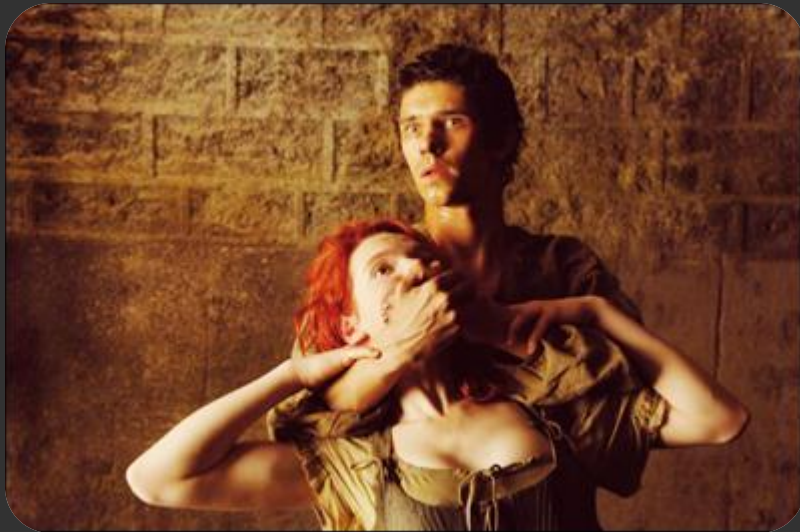
Кадр із фільму "Парфумер"

Жан-Батист Гренуй - це людина, яка заперечила головний закон: "Геній і злочинство не сумісні".