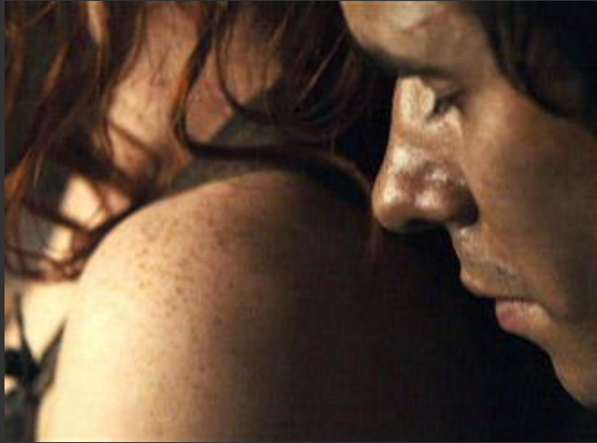
Кадр із фільму "Парфумер"