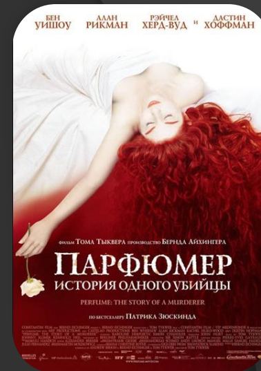
Обкладинка до роману

П'єсі «Контрабас» Зюскінд зобов'язаний тим, що 1985 року побачив світ його світовий бестселер «Парфумер».