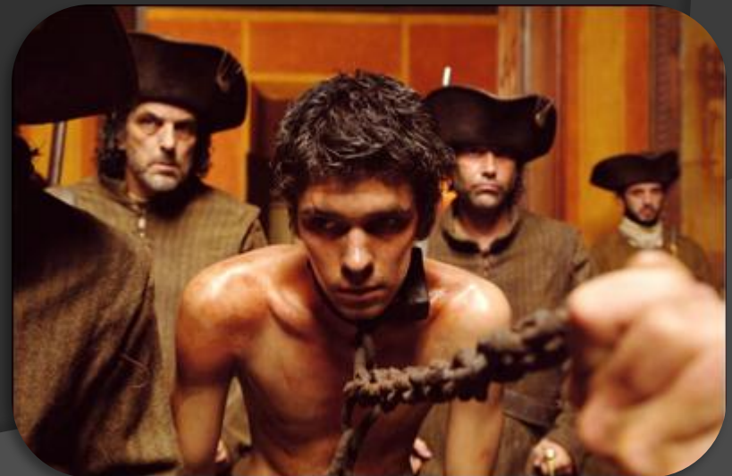
Кадр із фільму "Парфумер"

Жан-Батист Гренуй - це людина, яка заперечила головний закон: "Геній і злочинство не сумісні".