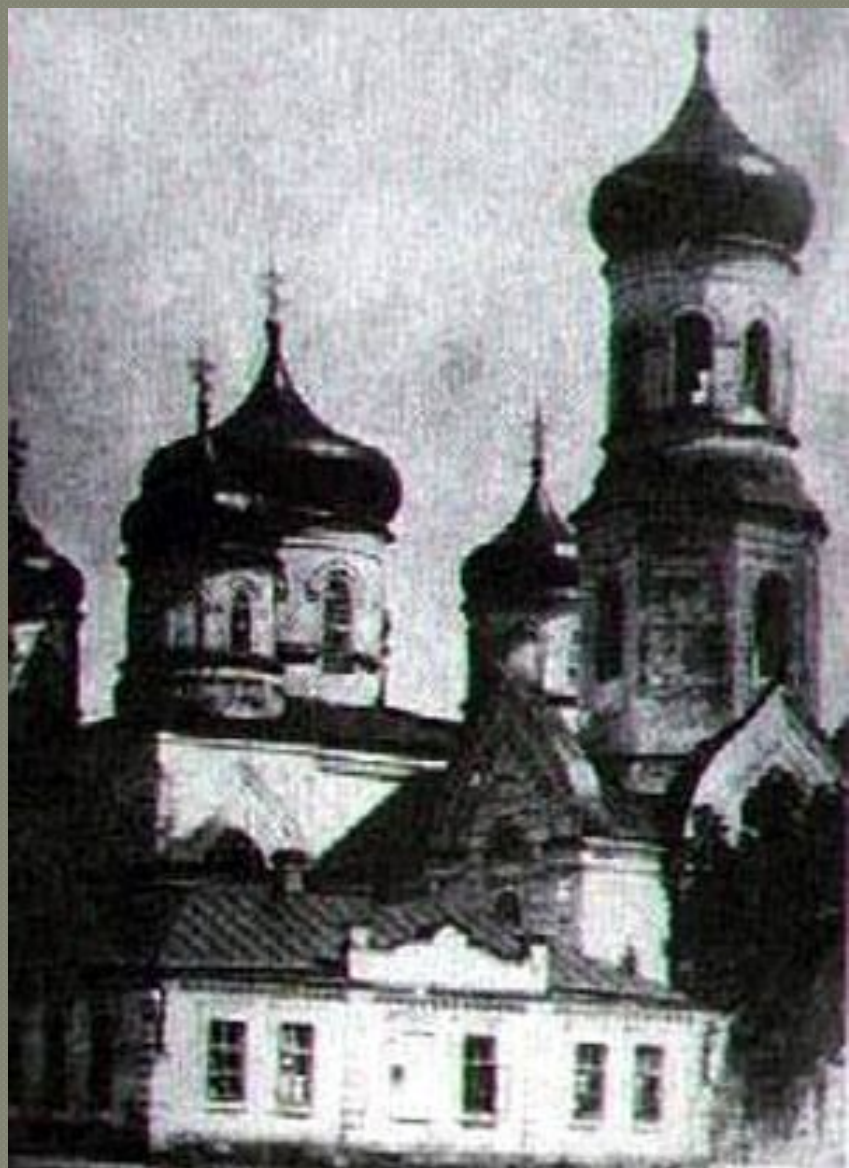
Христово - Воздвиженська церква

Народився Махно - 7 листопада 1888 року у селі Гуляйполе , Катеринославської губернії (Запорізької області). Наступного дня його охрестили у Христово - Воздвиженській церкві й дали ім'я Нестор