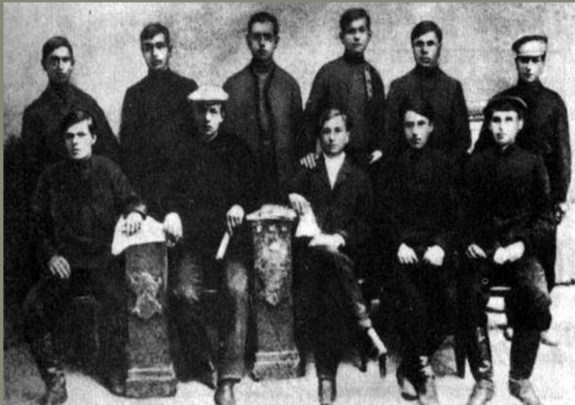
Нестор Махно ( крайній лівий, сидить )

займалися грабіжництвом поміщиків. Виручені гроші анархісти використовували на придбання зброї, яку купували навіть у Відні, на створення нових груп, на пропаганду і особисті потреби.