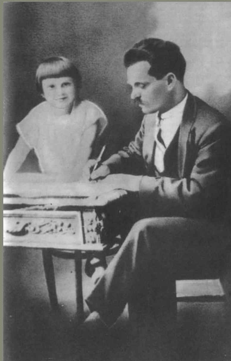
Нестор Махно з дочкою. Париж

Та все ж сил у було замало і більшовики за допомогою військової сили та підступних зрад - перемогли Нестора Махно. На протязі 1921—1934 років Нестор Іванович разом із сім'єю перебував у еміграції. Підтримував активні зв'язки з міжнародним анархістським рухом, друкувався в «Анархическом веснике» та «Деле труда».