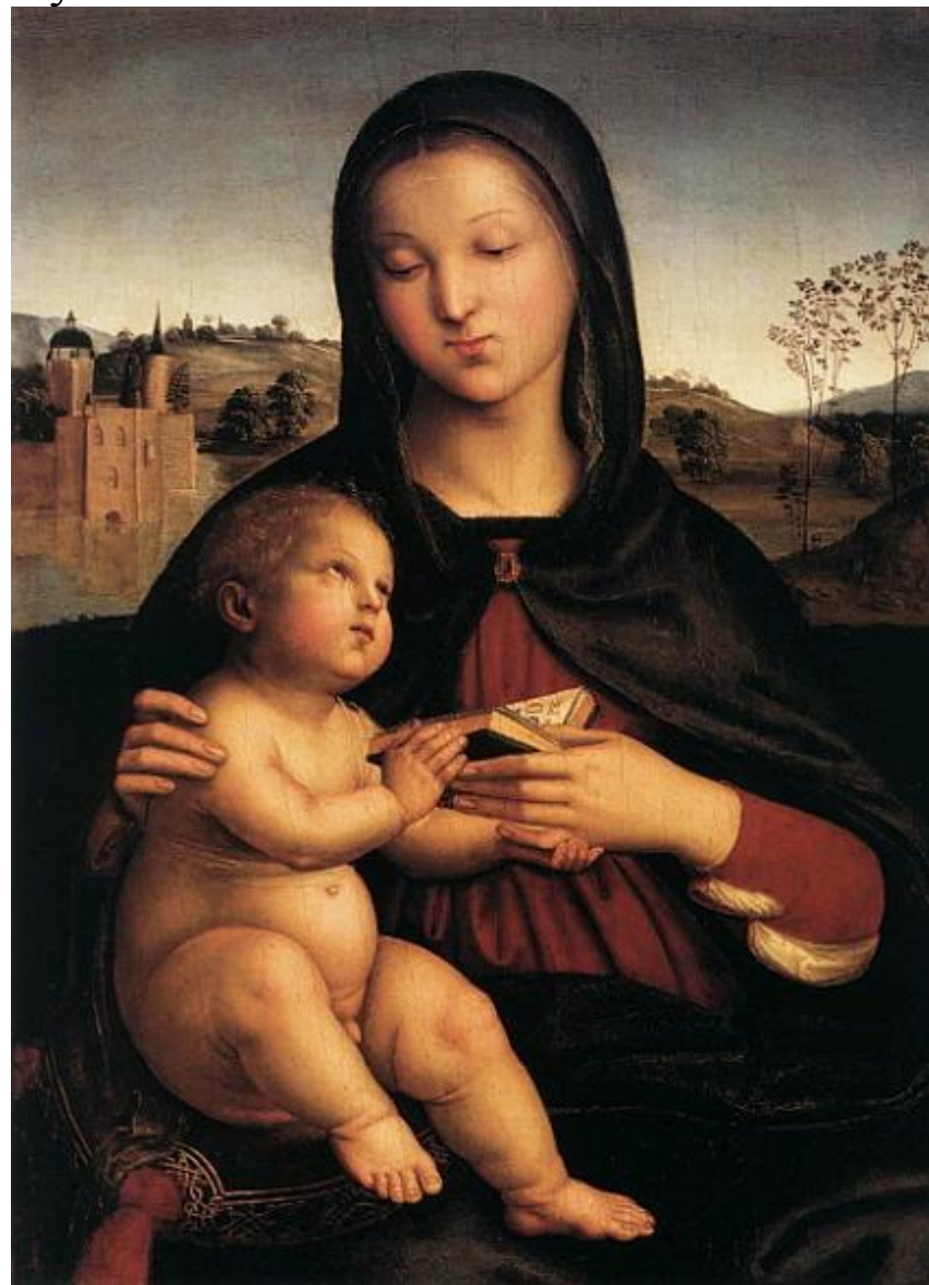
Оқып отырған Мадонна. шамамен 1500