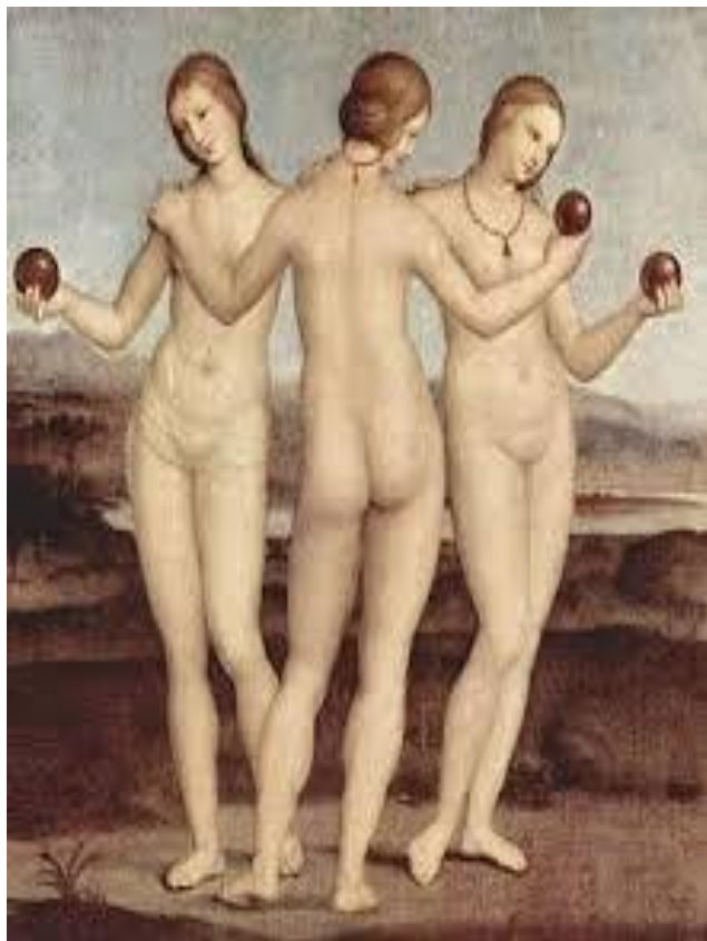
Үш грация. 1504

Ай мүсін, ашық жүз, нұрлы дидар, сымбатты сәулетпен құйылысқан үйлесімділік суретші қаламынан тамған әрбір тамшы бояудың сыры мен сыны сынды Үн қаттып тұрды. Рафаэль әйел затының пәк сұлулығына тәнті болды, тұңғығына Тереңдей берді. Соның нәтижесінде “Үш грация” және “Амур” атты суреттерін ертегректік Әйел құдайларға арнады. Ол өз суреттерінде әйелқұдайларын саналы түрде жалаңаш етіп салатын, Себебі әрбір көрермен биік өнердің қол тимеген нәзік те пәк табиғатына жақындайды деп Есептеді.