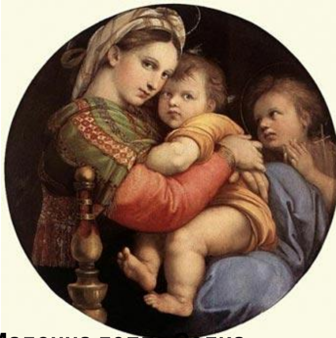
Мадонна делла Седиа 1514; 71 см в диаметре; дерево, Масло Галерея Палатина, Флоренция