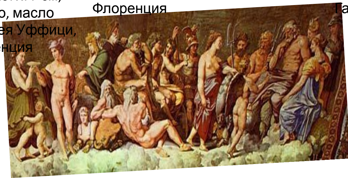
Гермес, вводящий Психею на Олимп 1517; 405x1200 см; фреска Лоджия Психеи, Вилла Фарнезина, Рим