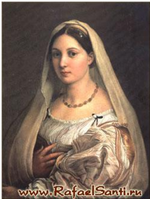
«Желбегей жамылған бикеш» шамамен 1514-1515.

Флоренциядағы Питти галериясындағы Рафаэльдің “Донна Велата” атты суреті көп уақытқа дейін құпия боп келді. Бұл Рафаэльдің өмірінің соңына дейін махаббаты болған Вазари болуы мүмкін деген болжамдар бар. Вазари Рафаэльдің “Бөлішке сатушылар” немесе “Форнариндар” (1515, Рим, Барберини сарайы) атты суреттерін позициялаған болатын. Аңыз желісі бойынша Рафаэль Тибр жағасында Маргарита Лути Атты наубайшының 17 жасар қызын модель болуға өзінің студиясына шақырған. Осылайша олардың арасында махаббат пайда болып, ол махаббат 6 жылға, яғни шебер өмірінің соңына дейін жалғасқан.