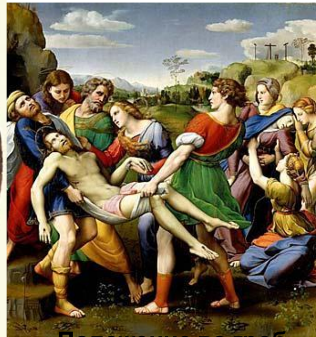
Положение во гроб 1507; 184x176 см; дерево, масло Галерея Боргезе, Рим