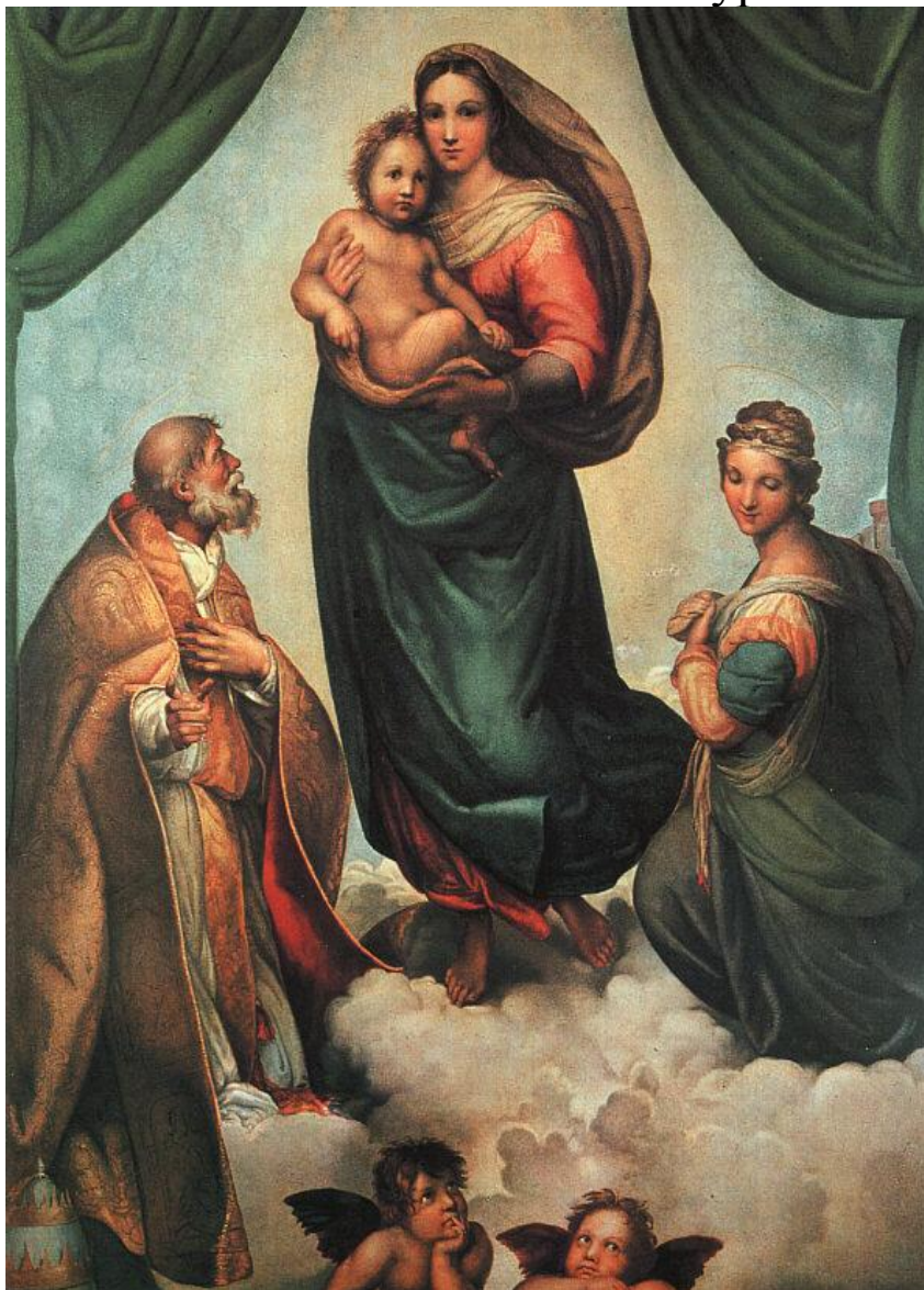
«Сикстин мадоннасы». 1503

Рафаель шын есімі Раффаэлло Санти немесе Санцио 1483 жылы 28 наурызда Урбинода Дүниеге келіп, 1520 жылы 6 сәуірде Римде қайтыс болған итальяндық суретші және сәулетші.