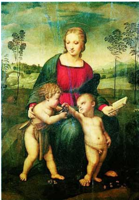
Мадонна со щегленком 1507; 107x77 см; дерево, масло Галерея Уффици, Флоренция