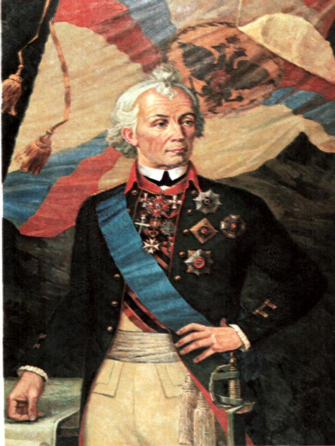
А.В. СУВОРОВ Художник А.Семенов.