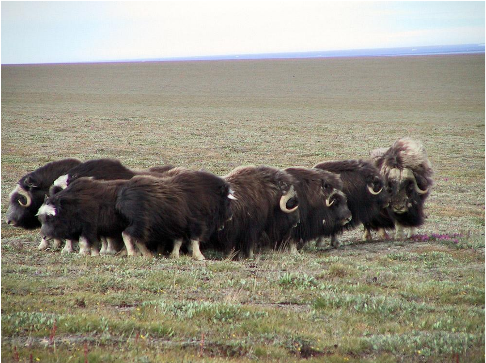
Групова поведінка. Оборона у вівцебиків