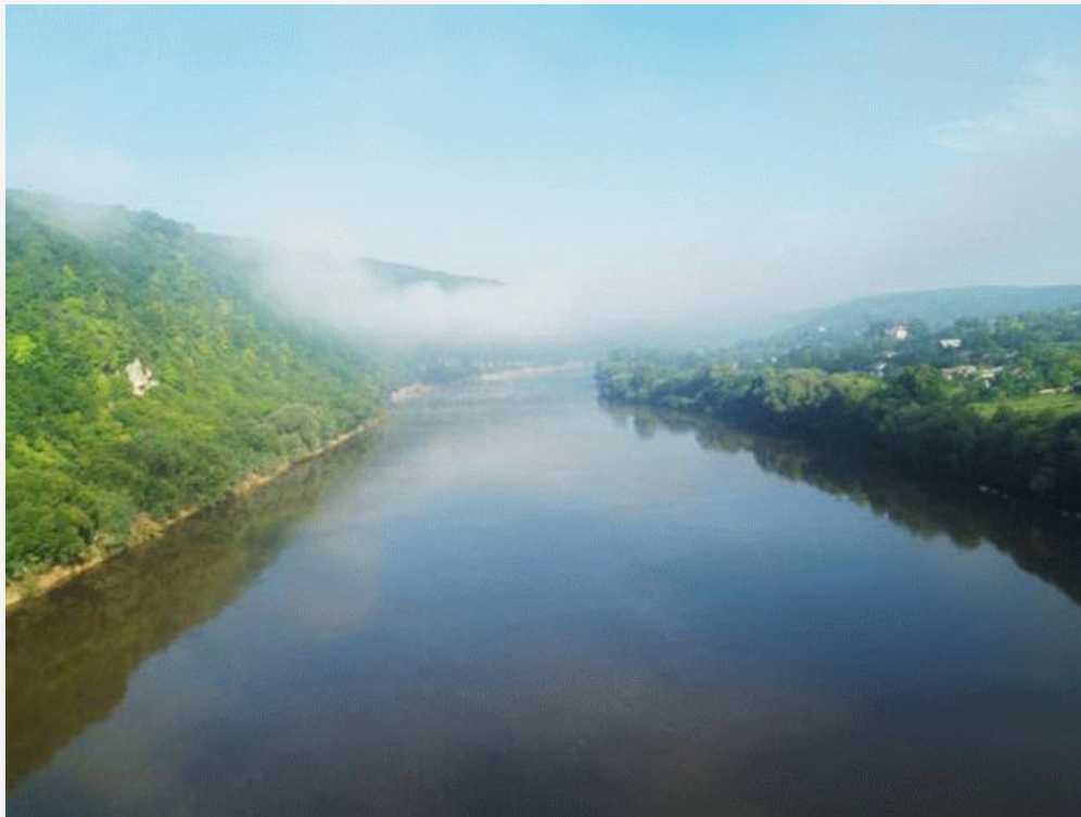
Туман над Дністром на кордоні Тернопільської і Івано-Франківської областей

Тумани бувають на всій території України впродовж кількох десятків днів, найчастіше – в холодний період року. Найбільше їх спостерігається у гірських районах, на півночі та заході країни. Особливо небезпечні сильні тумани для транспорту, коли видимість знижується до 50 м.