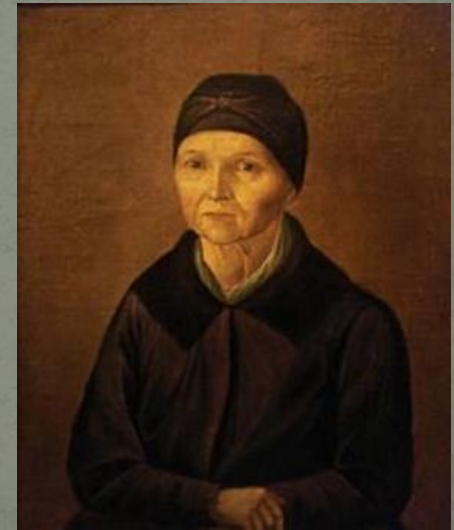
М.А. Ганнибал и Арина Родионовна