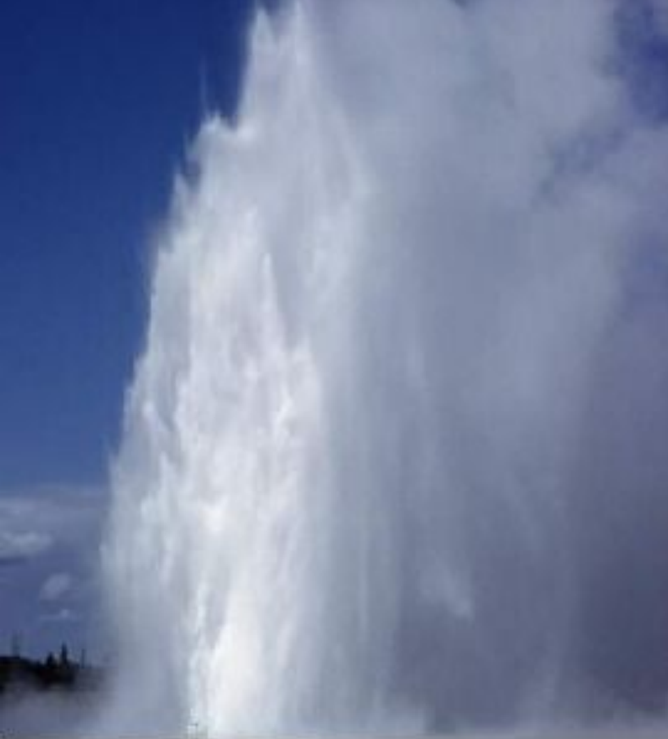
Гейзер Сплендид (Splendid Geyser)