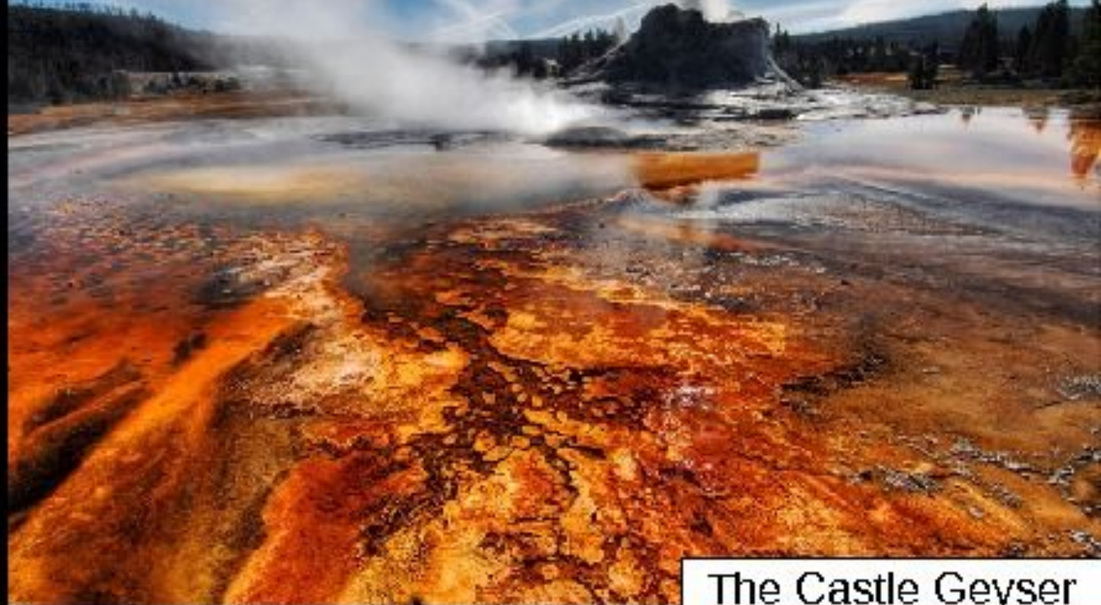
The Castle Geyser