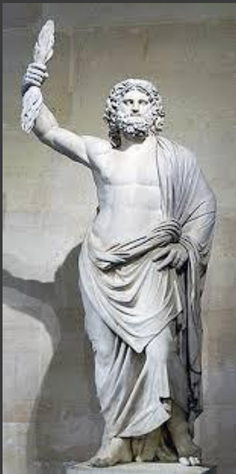
жоғарғы әмірші құдай