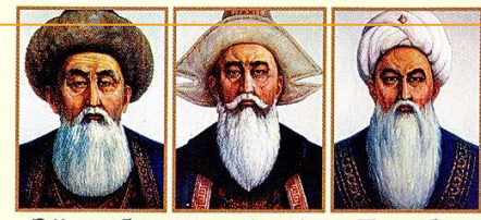
Әйтке би Қазыбек би Төле би