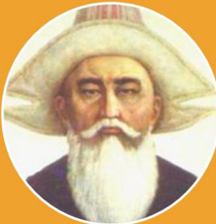
Қаз дауысты Қазыбек би