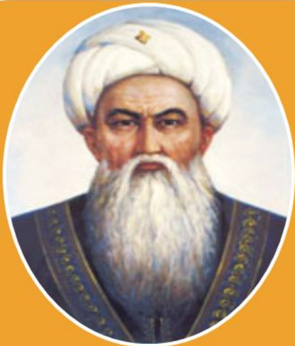
Үйсін Төле би