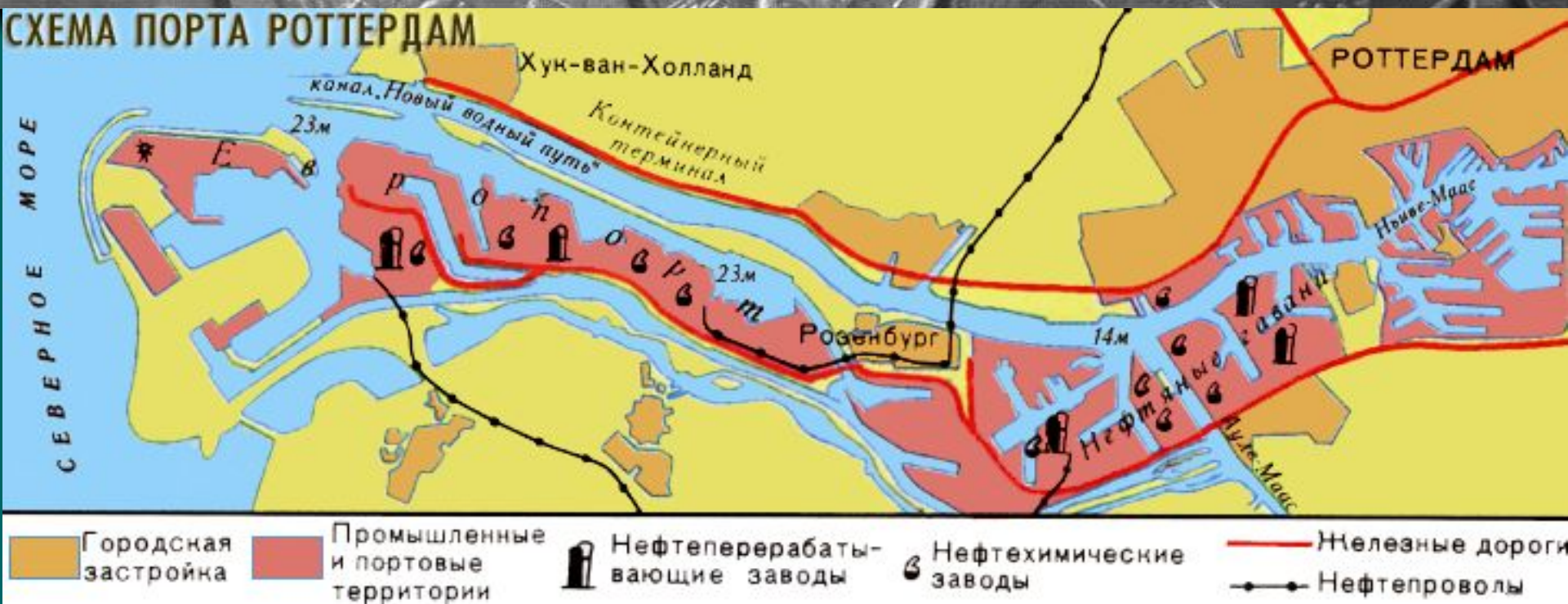
СХЕМА ПОРТА РОТТЕРДАМ

Из каких видов дорог состоит полимагистраль порта Роттердам