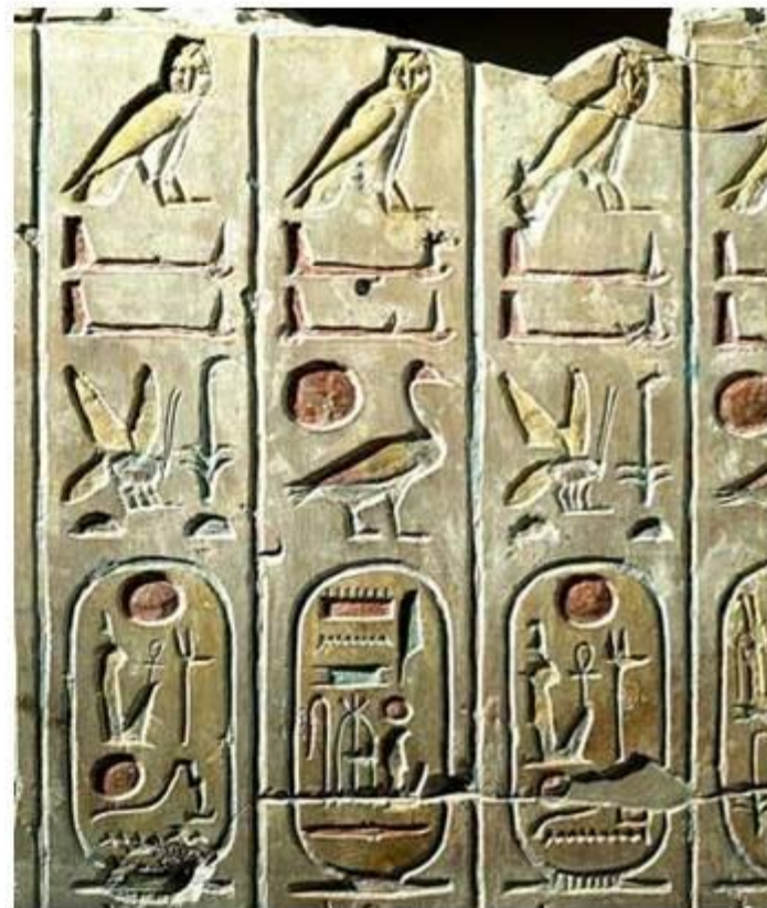
Тасқа жазылған иероглифтер.

Египетте жазу өнері б.з.б. IV м.ж. пайда болды. Ең алғаш жазулар сурет ретінде салынған. Ең алғаш жазуларды таңбалар мен суреттер құрады. Бұндай таңбалар иероглифтер деп аталды, ал египеттік жазу иероглифика деп аталады. Олардың саны 700-ден аса болды, ал кейінірек тіпті бірнеше мыңға дейін жетті. Иероглифтер ондағы бейнелер қайда қарап тұр, солай оқылады. Однан солға немесе солдан оңға.