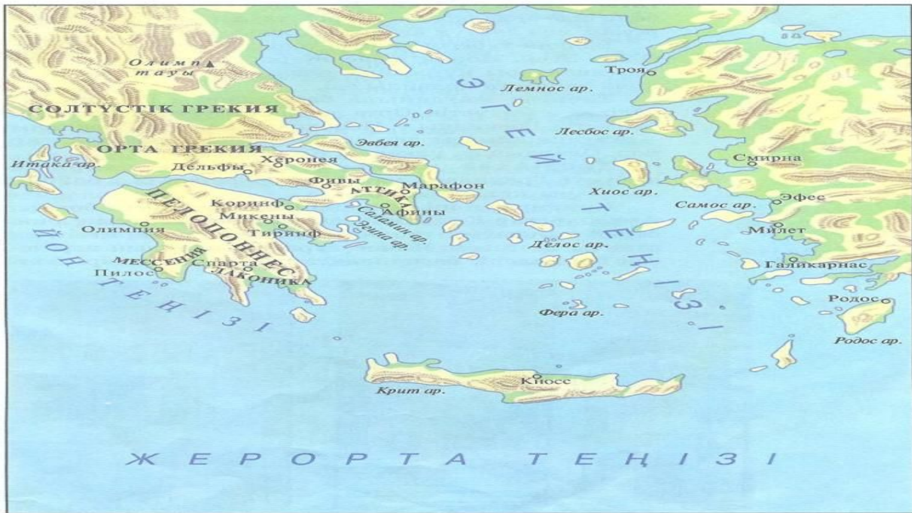
Ежелгі Грекия картасы

Ежелгі Грекия немес Эллада (гр. Ελλάδα) — б.з.б. III мыңжылдықтан б.з.б. I ғасырына дейін болған ежелгі грек мемлекеттері жерінің жалпы аты; Балкан түбегінің оңтүстігін, Эгей теңізіндегі аралдарды, Фракия жағалауын, Кіші Азияның батыс өңірін ала орналасқан.