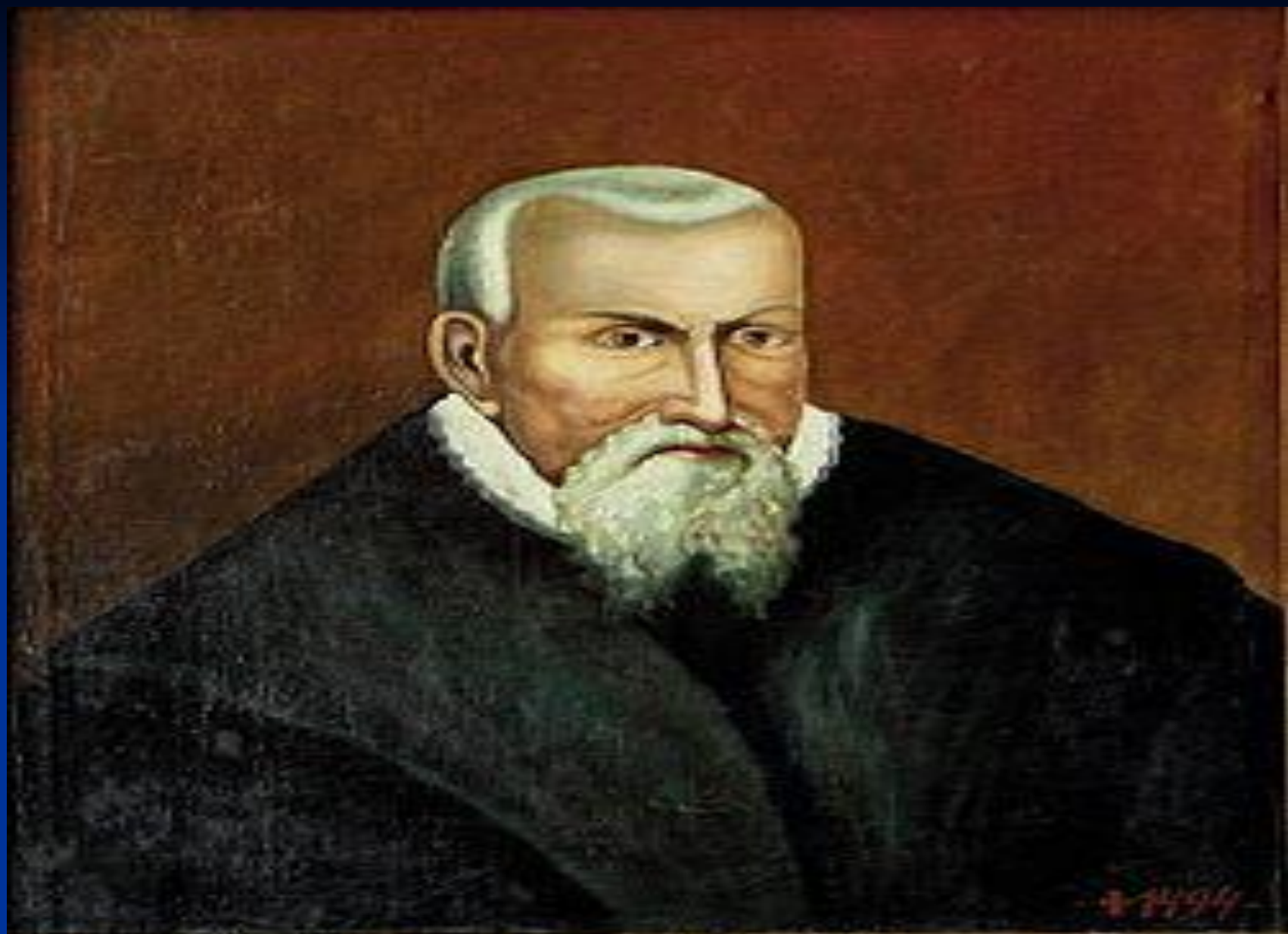
Magister Georgius Drohobicz de Russia.