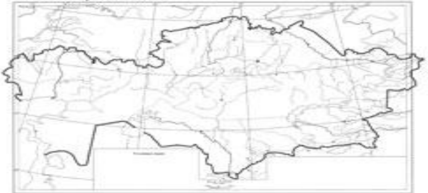
Физическая карта Казахстана