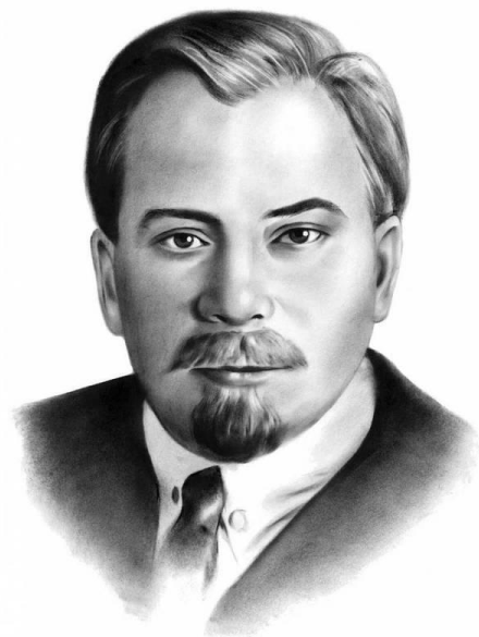
Олександр Олесь (1878—1944)

У 1919 р. поет покинув свою батьківщину і опинився у таборі націоналістичної еміграції. 25 років прожив він за межами України. З 1923 року до останнього дня свого життя жив він у Чехословаччині.