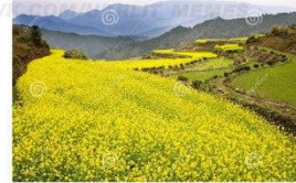
3-5 ВПОДОБАЙОК: ТИ ВЕСНА ЗОЛОТА