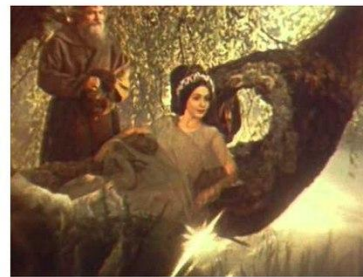
15+ ВПОДОБАЙОК: ТИ ЛІСОВА МАВКА (усі дівки на селі заздять твоїм чарам)