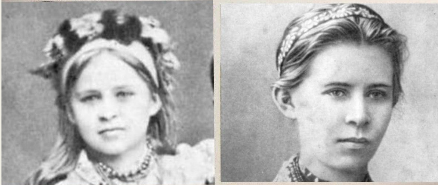
Рис. 218. Зміна обличчя юнака до й після статевого дозрівання

§ 65. Фізіологічні механізми запліднення і внутрішньоутробного розвитку