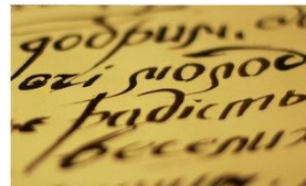
10-14 ВПОДОБАЙОК: ТИ ЩИРА ГАРТОВАНА МОВА (яку Леся видобуть з піхви готова)