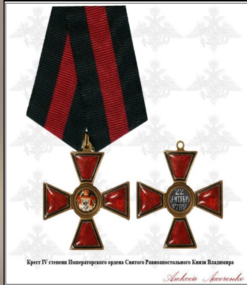
Крест IV степени Императорского ордена Святого равноапостольного Князя Владимира