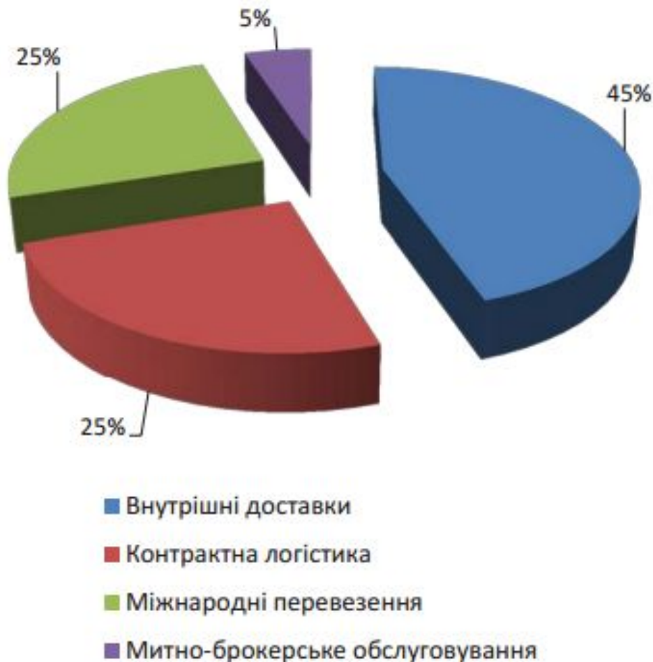
Рис. 3. Структура ринку логістики в Україні

Зміни у внутрішньополітичній ситуації в Україні зробили істотний вплив на ведення бізнесу і ринок логістичних послуг.