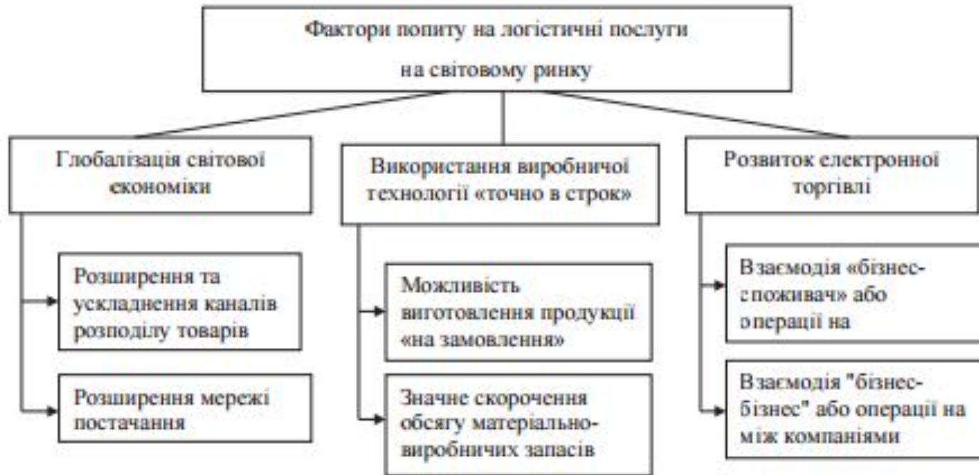
Рис. 1. Фактори росту попиту на логістичні послуги на світовому ринку

Останнім часом темпи зростання обсягів послуг логістики, характерні для розвинених країн, стали спостерігатися вже практично у всіх країнах, залучених у світову торгівлю товарами і послугами. Більш того логістика стала таким собі каталізатором протікання глобалізації.