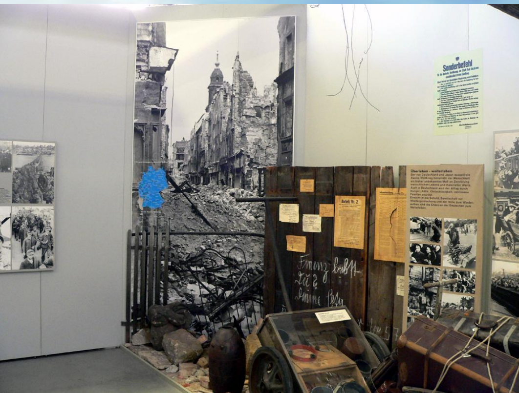
Экспозиция Военно-исторического музея в Дрездене.

Музейная экспозиция – это целенаправленная и научно обоснованная демонстрация музейных предметов, которые организованы композиционно, снабжены комментарием, технически и художественно оформлены и в итоге создают специфический музейный образ природных и общественных явлений. Музей создает не только постоянные, но и временные экспозиции – выставки .