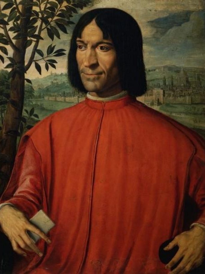
Маккьетти Джироламо. Портрет Лоренцо де Медици

В ранний период Ренессанса Лоренцо де Медичи дал указания по созданию в Флоренции Сада Скульптур. В XVI веке было модно размещать в больших и длинных коридорах дворцов скульптуры и картины. В XVII веке при строительстве дворцов стали специально планировать помещения для коллекций картин, скульптур, книг и гравюр. К этому времени в княжеских особняках стали специально создавать помещения для произведений искусства.