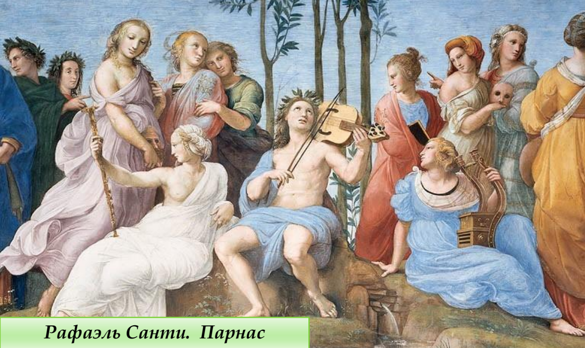
Рафаэль Санти. Парнас