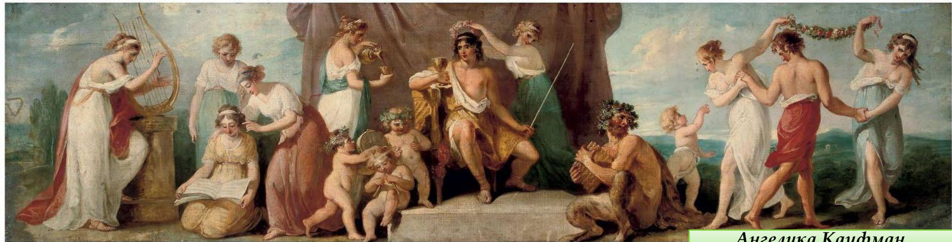
Ангелика Кауфман. Аполлон и Музы

Музы — в древнегреческой мифологии, живущие на Парнасе богини — покровительницы искусств и наук: