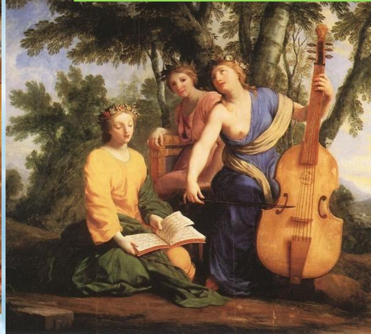
Ле Саер Евстафия. "Музы".

В местах поклонения музам – мусейонах, стали со временем накапливаться дары богам – храмовые сокровищницы. Они представляли собой предметы, которые, согласно религиозной традиции, приносились божествам по обету, в честь одержанной победы, для исцеления, исполнения просьбы, при покаянии. Богам посвящались скульптурные изображения людей, животных, статуи, вазы, живописные работы, военные трофеи, связанные с культурой народов – варваров, а также образцы экзотической природы.