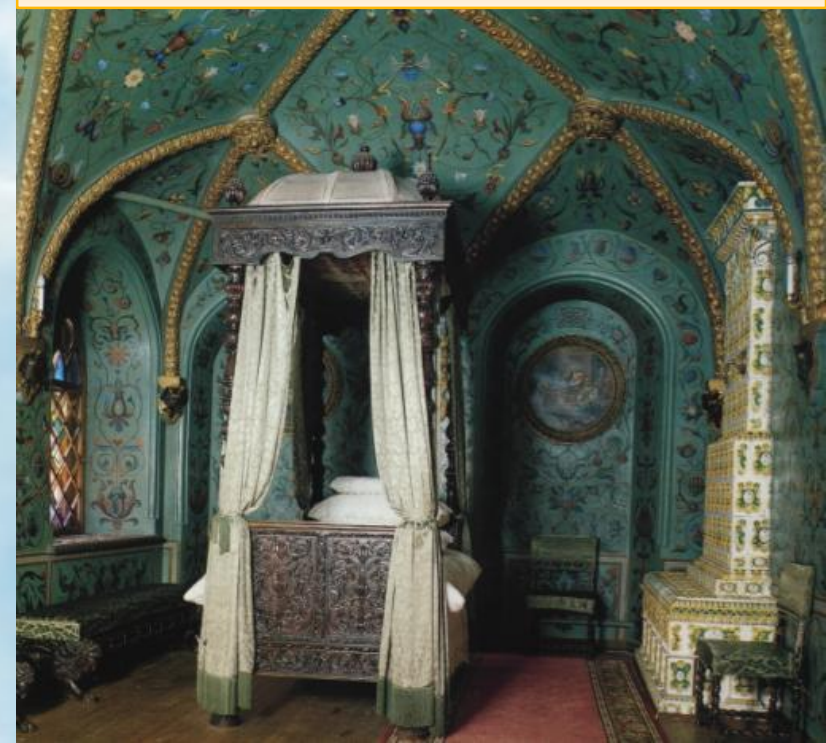
Теремной дворец Московского Кремля. «Почивальная комната», XVII в.