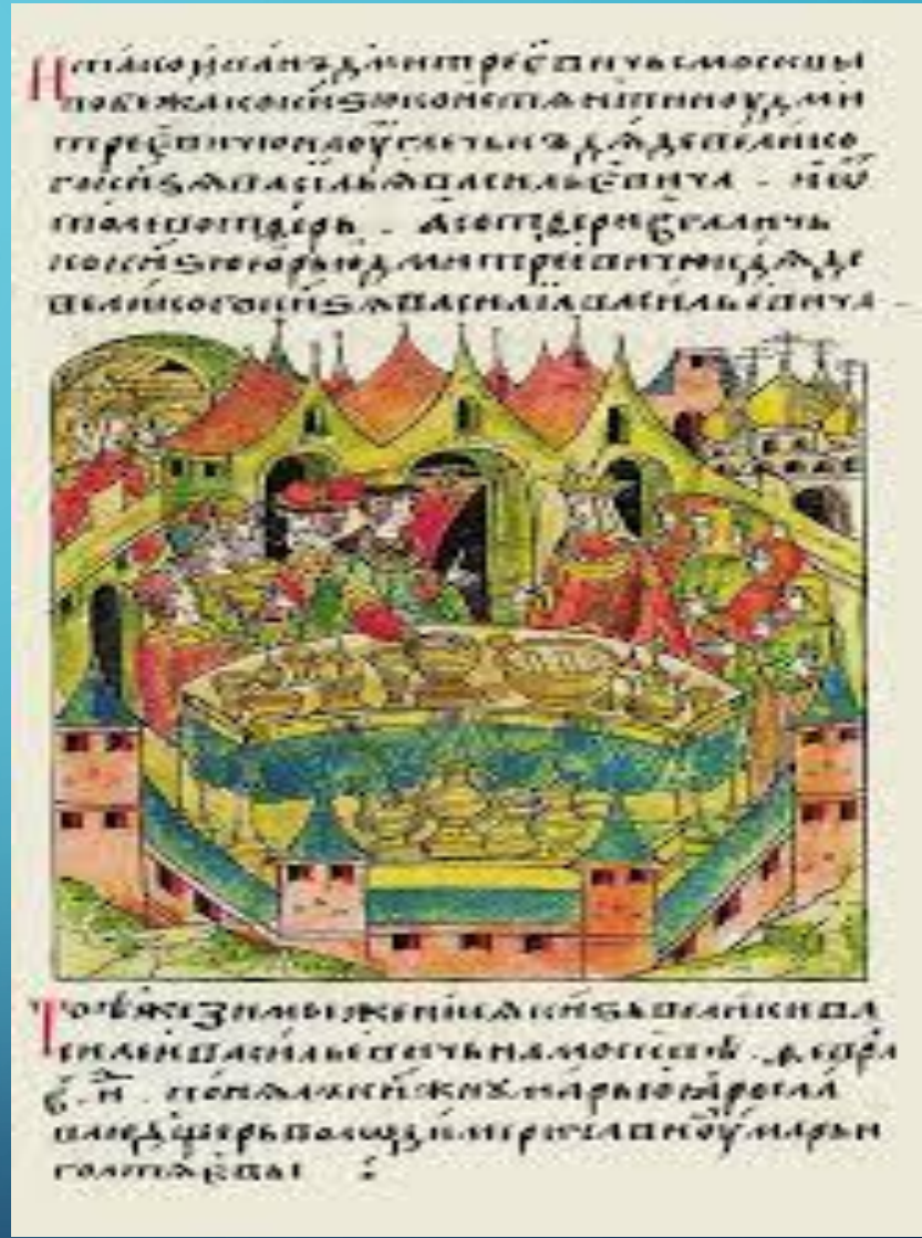
Мария Ярославна На своей свадьбе с Василием Темным