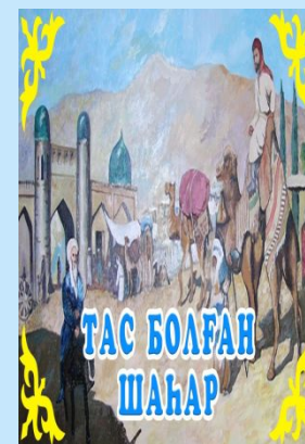
Тас болған шаһар