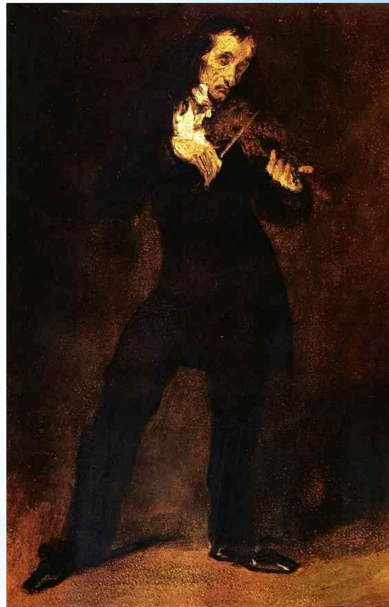
Эжен Делакруа. Портрет Паганини.