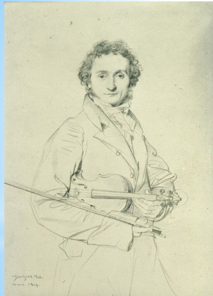
Жан Огюст Доменик Энгр. Портрет Паганини.