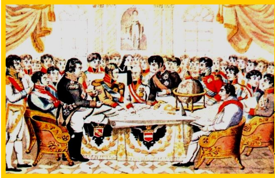
Європейські монархи ділять Європи. Карикатура