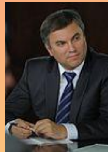
Volodin V. V.