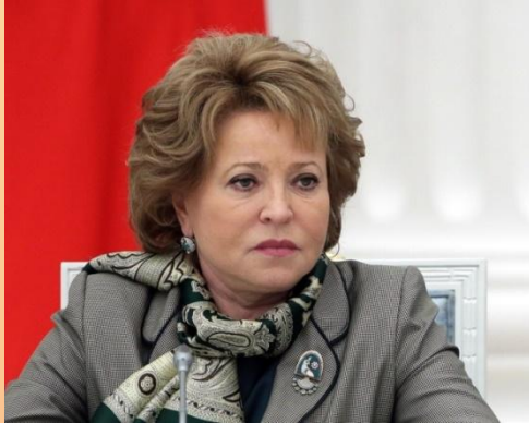
Matvienko V. I.