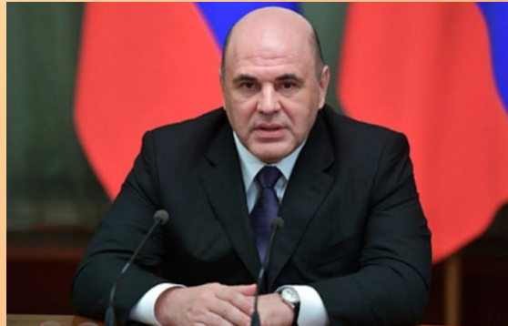
Mishustin M. V.