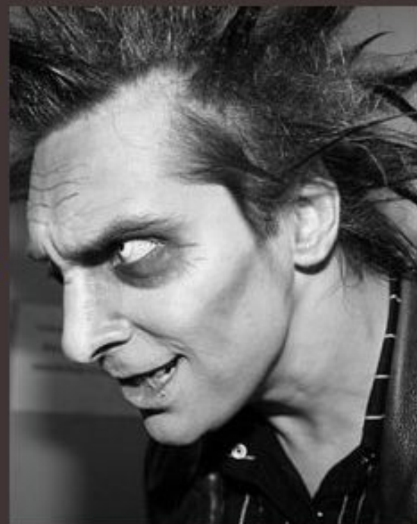
Михаил Горшенев (Король и Шут)

"Я уйду в тот момент, когда не успею Вам надоест. А Вы будете помнить меня добрым словом, за то, что я не надоел и не стал дураком, зарабатывающим на Вас деньги..."