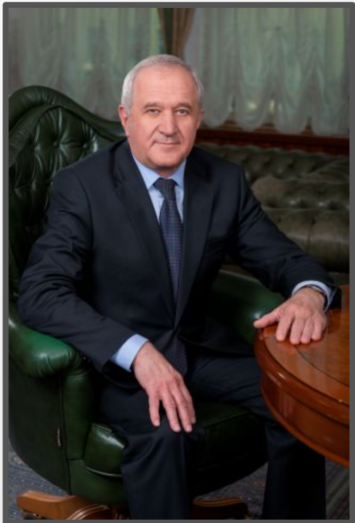
Булавин Владимир Иванович Руководитель ФТС России