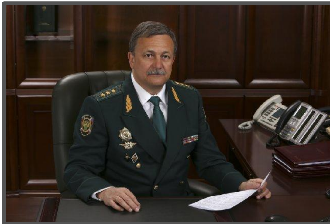
Давыдов Руслан Валентинович Первый заместитель руководителя ФТС России