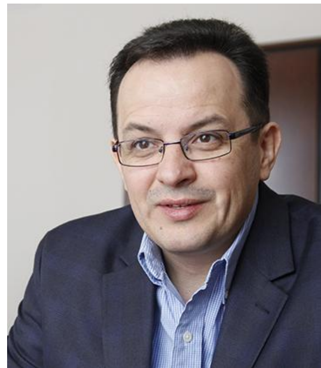
Керівник фракції Самопоміч у Верховній Раді - Олег Березюк.