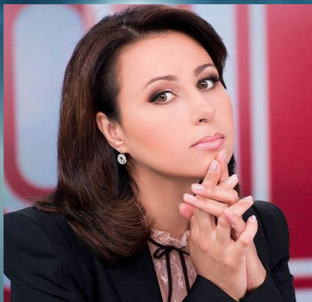
Наталя Мосійчук – журналіст, ведуча ТСН на каналі “1+1”.