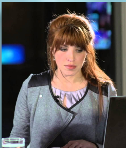
Юлія Костюшко – ведуча телеканалу “СК1”.