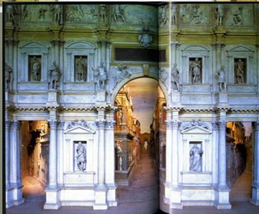
Декорации Театра Фарнезе