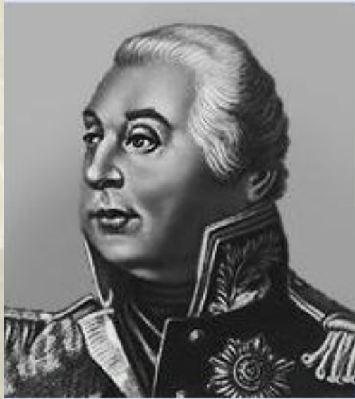
М. И. Кутузов.