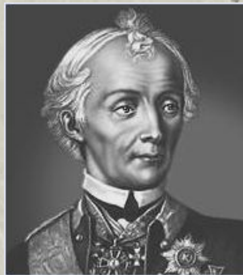
А. В. Суворов.